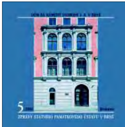
Obálka publikace Zprávy Státního památkového ústavu v Brně, číslo 5/2001 věnované budově na nám. Svobody 8