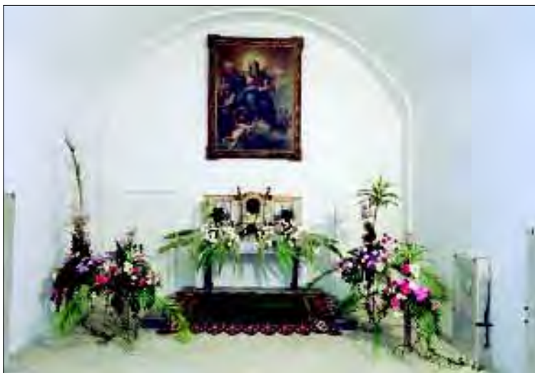
Státní zámek Rájec nad Svitavou, výstava Rájecké jiřinky

Zvláštní kulturní akce zůstaly v tradičním rozsahu podniků, které je možno označit pro hrad Pernštejn rovněž za již tradiční. Bylo to poskytnutí „Rytířského sálu“ pro jeden z cyklu koncertů Concentus Moraviae, účast na „Slavnostech perňštejnského panství“ a výstava aranžmá podzimních květů a plodin v interiérech, nyní již konečně pod názvem „Podzim na Pernštejně“.