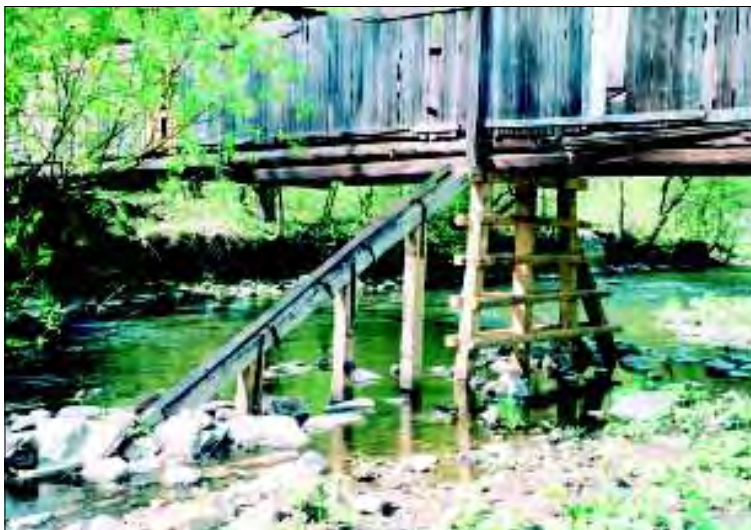
Prudká u Doubravníka, dřevěná krytá lávka při opravě a rekonstruovaná bárka s ledolamem

kostela sv. Havla v Rožné , díky finančnímu příspěvku ze střešního fondu se podařilo uskutečnit záchranu střechy ještě v témž roce. Další etapou pokračuje restaurování vitráží oken kostela Povýšení sv. Kříže v Doubravníku . Mezi nejzdařilejší akce pak lze zahrnout opravu fasády kostela sv. Bartoloměje v Rozsochách . Při opravě se zde podařilo zachovat vrstvy historických omítek s hrubou strukturou a obnovit původní barevnost kostela dle restaurátorského průzkumu. Kombinace červené terakoty s bílými profilovanými prvky byla provedena ve vápenné barvě.