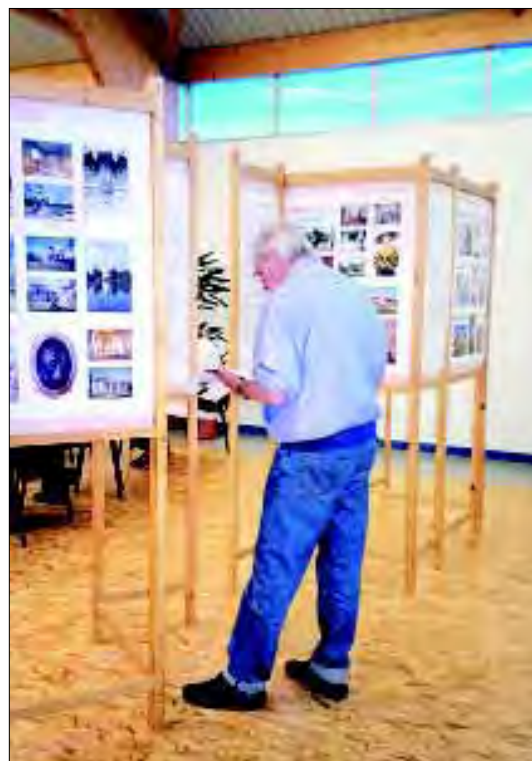
Výstava Hradů a zámkyve správě SPÚ v Brně v Ay – sur – Moselle