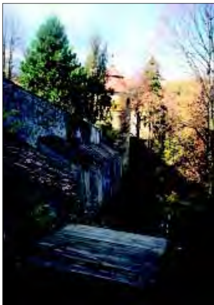
Račice – zeď II. nádvoří a zvonice před opravou

Nádražní 4 , bývalé základní školy, které po letech devastace bez využití hrozila demolice. Objekt je významným urbanistickým prvkem města ze 2. poloviny 19. století, neboť jde o palácovou architekturu s vnitřním nádvořím, v prostředí vyškovského okresu zcela ojedinělou. V minulém roce pokračovala jeho rekonstrukce pro účely Městské knihovny a Základní umělecké školy. V rámci městské památkové zóny Slavkova u Brna dochází k postupné modernizaci objektů, opravám fasád, výměně oken a výkladců. Pokračovala rekonstrukce objektu bývalé židovské školy opravou stropních konstrukcí. V loňském roce byla ukončena celková rekonstrukce objektu Palackého č. p. 3 v části využívané MěÚ. Stavební práce probíhají na památkově chráněném domě charakteru polozemědělské usedlosti na Palackého náměstí č. p. 80 . Na zámku ve Slavkově u Brna byla opravena část krovu v rizalitu jižního křídla. Původní barokní krov zámku se nachází v alarmujícím stavu, jeho opravy však probíhají pouze v místech hrozících akutní havárií. K postupné celkové záchraně cenného krovu, která by ho snad ještě dokázala zachovat v původním konstrukčním výrazu včetně