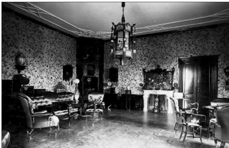
Původní stav interiéru knížecího apartmá v 1. patře zámku Lednice, dobová pohlednice