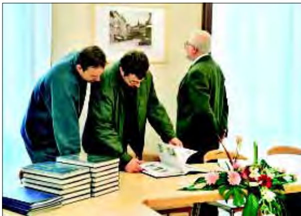
Zahájení provozu nového sídla SPÚ na nám. Svobody 8, prezentace knihy Památková péče na Moravě

Pohlednice (4 druhy): portréty Serényiů ze zámku Milotice