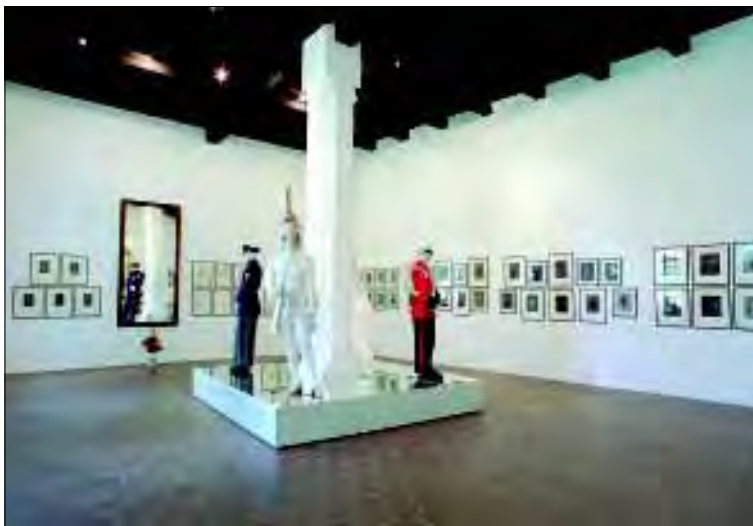
Státní hrad Bítov, výstava porcelánu