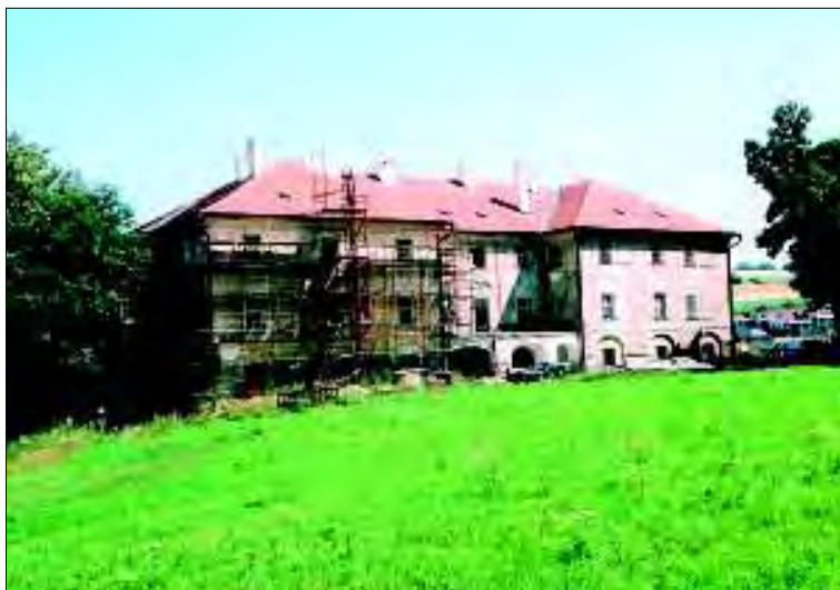
Luka nad Jihlavou, zámek, obnova statiky a fasády