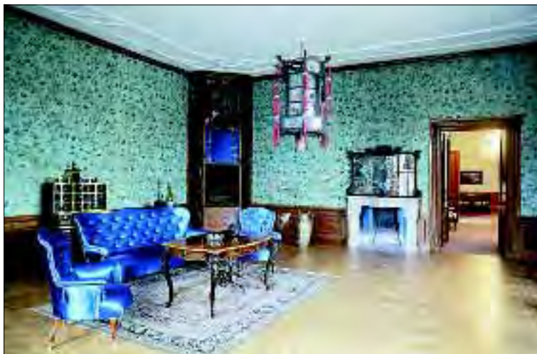
Nová instalace v knížecím apartmá v 1. patře zámku Lednice