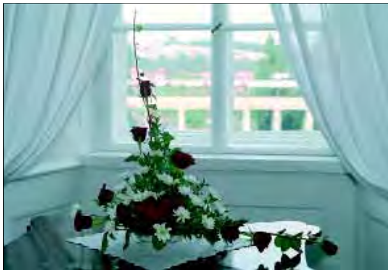
Státní zámek Lysice, květinové aranžmá v interiéru, foto: Miroslav Zavadil

Vánoční výstava s doprovodným programem – prosinec.