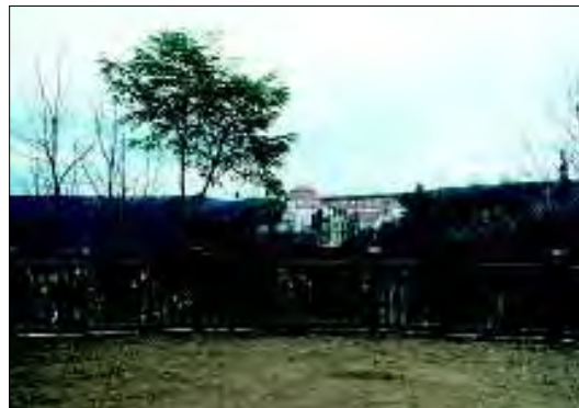
Obnovený Tyršův sad v Brně, exkurze pro členy Společnosti zahrada – park – krajina, foto: Dagmar Fetterová