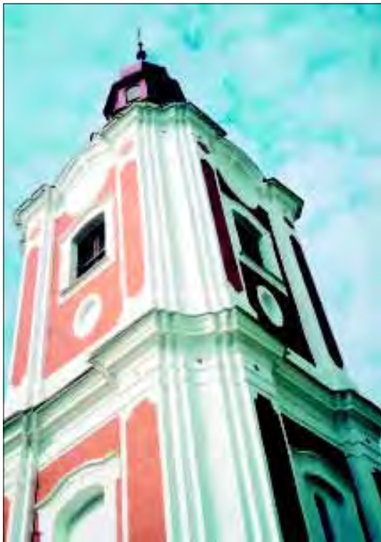
Rozsochy, kostel sv. Bartoloměje po opravě fasády

městečka. V současné době je až na několik málo výjimek kompletně opraveno náměstí sídla, které je příkladem citlivého přístupu v celém regionu. V dalších obcích Novoměstska a Žďárska probíhaly spíše drobné opravné práce památkového charakteru. V průběhu roku 2002 byla také projednávána územně plánovací dokumentace pro obce Nové Veselí, Polnička, Herálec, Strachujov Radenice, Nové Dvory, Velká Losenice, Nížkov, Milešín, Nová Ves, Heřmanov, Vidonín, Radňoves, Vatín, Ostrov nad Oslavou a další.