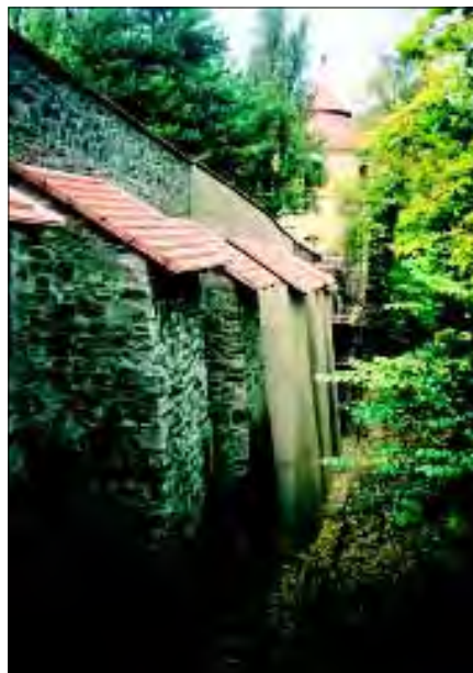
Račice – zeď II. nádvoří a zvonice po opravě