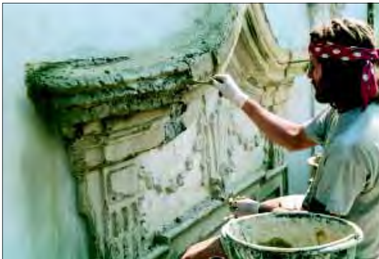
Hostim, zámek, restaurování kamenného dekoru okna průčelí, foto: archiv NPÚ ÚOP v Brně

Vedle množství stavebních prací menšího rozsahu na světských kulturních památkách a objektech na územích zájmu památkové péče ( Městská památková zóna Jevišovice a Moravský Krumlov ) lze uvést následující rozsáhlejší akce, realizované v roce 2002. Např. byla dokončena celková obnova hlavní budovy zámku v Hostimi v užívání Domova důchodců Hostim, kde nejdůležitější stavební prací v roce 2002 bylo provedení opravy fasády včetně výměny většiny výplní stavebních otvorů, restaurování jejich kamenných ostění, šambrán a veškerého architektonického dekoru z kamene a štuky (viz foto) a provedení finálního nátěru fasády. Kolem zámeckého parku zámku ve Skalici byla prováděna a dokončena úplná rekonstrukce ohradní zdi s uplatněním konstrukčních detailů, eliminujících dosavadní příčiny stavebních poruch zdi. Na zámku v Břežanech , v užívání Ústavu sociální péče Břežany, byl operativně odstraněn havarijný stav části krovu a stropu nad chodbou 2. NP ve střední části jižního křídla. V areálu zámku v Plavči , v užívání Domova důchodců Plaveč, bylo provedeno odvlhčení zdiva spodní stavby a oprava fasády bývalé barokní sýpky, včetně finálního nátěru. V roce 2003 je však nutné provést zásadní opravu protékající konstrukce střechy románské rotundy Panny Marie v zámeckém parku. Stavební poruchu střechy, která se nečekaně projevila, se nepodařilo odstranit pro nedostatek