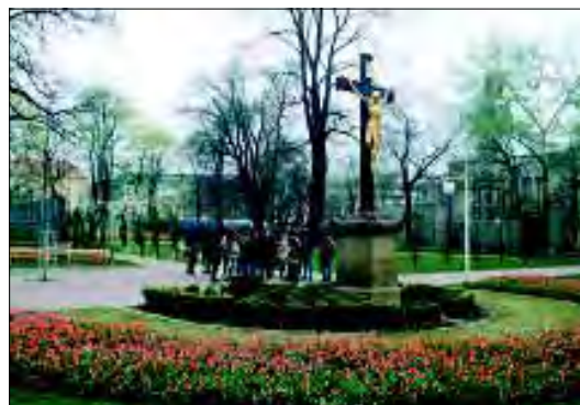
Jinošov, obnovený Apollónův altán, exkurze pro Společnost zahrada – park – krajina