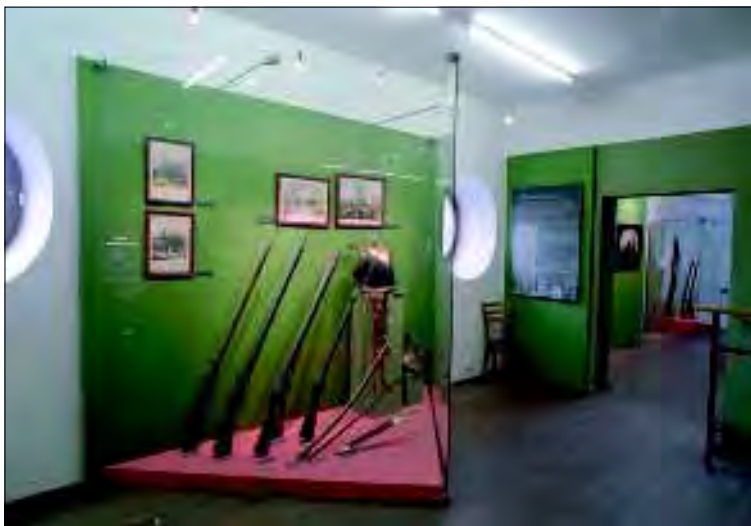
Státní zámek Vranov nad Dyjí, výstava Zbraně pro boj, sport i lov

Údržba se omezila na provedení generální opravy vyhlídkového ochozu předního hradu a na provedení některých drobných konzervačních zásahů. V roce 2003 počítáme především se zajištěním havarijní statické poruchy na průčelí myslivny a s dokončením stavebně historického průzkumu fortifikace i obou hradů.