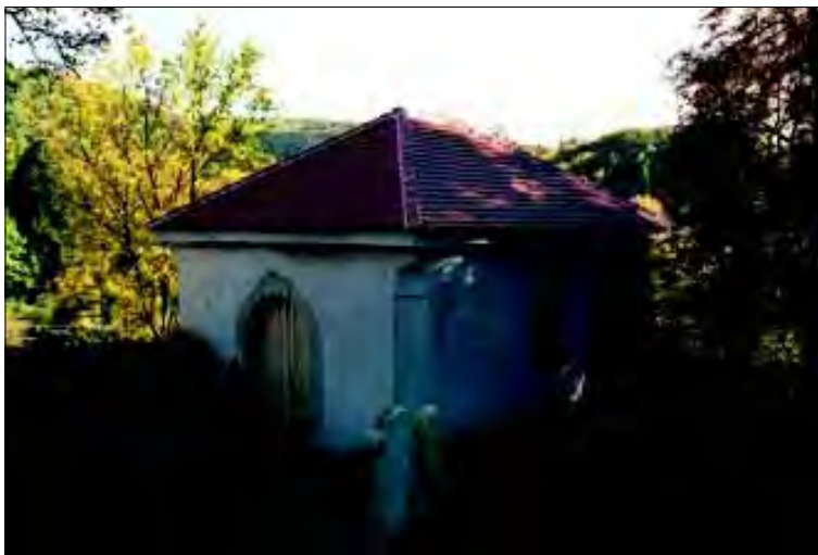
Boskovice, kostel sv. Jakuba St., severní stěna po opravě