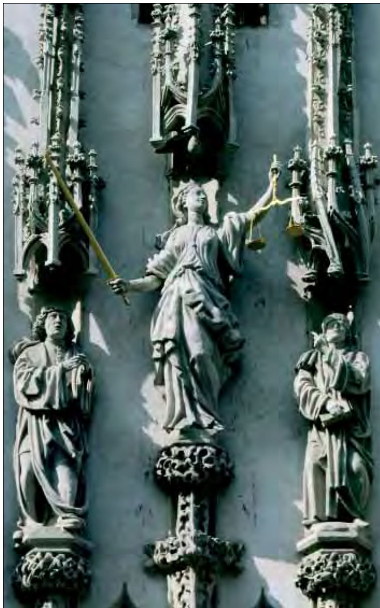
Ilustrace z obálky publikace Památková péče na Moravě, portál Staré radnice v Brně, foto: archiv NPÚ ÚOP v Brně