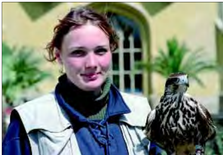
Státní zámek Lednice, ukázky sokolnictví v parku

Rok 2002 lze hodnotit jako nejúspěšnější rok za posledních 10 let vzhledem k objemu rekonstrukčních prací, které byly na objektu provedeny, a hlavně vzhledem k nárůstu návštěvnosti a tržeb.