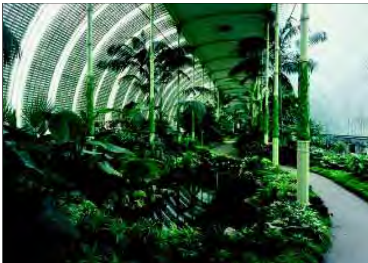
Zámecký palmový skleník v Lednici po opravě