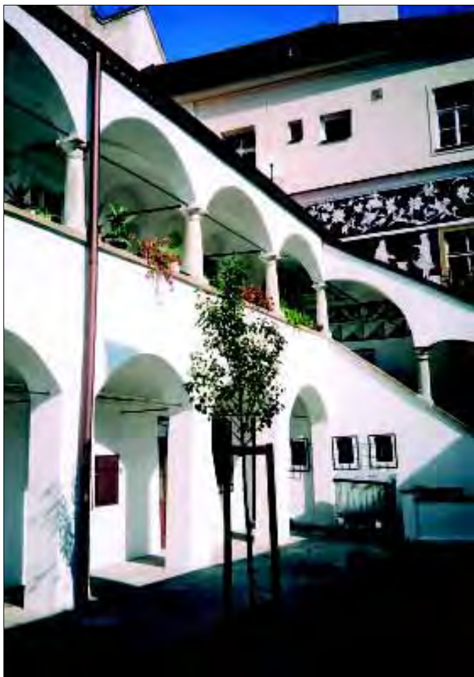
Mikulov, oprava zámeckého nádvoří, foto: archiv NPÚ ÚOP v Brně