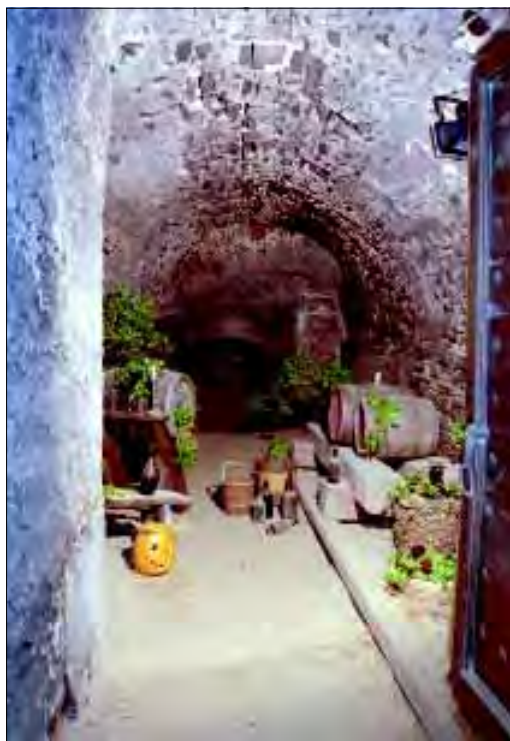
Státní hrad Pernštejn, výstava Podzim na Pernštejně