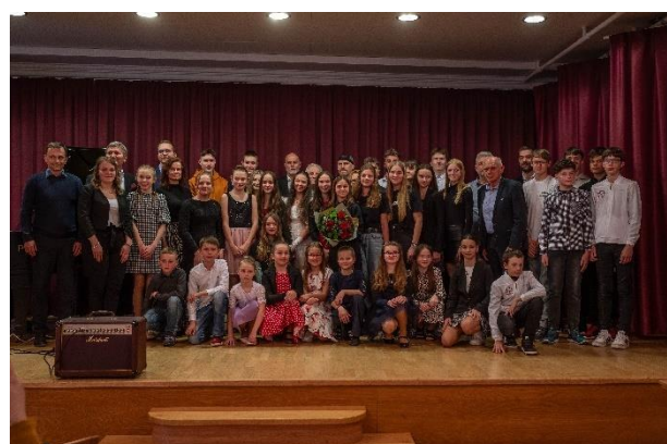
Vyhlášení ankety Sportovec města