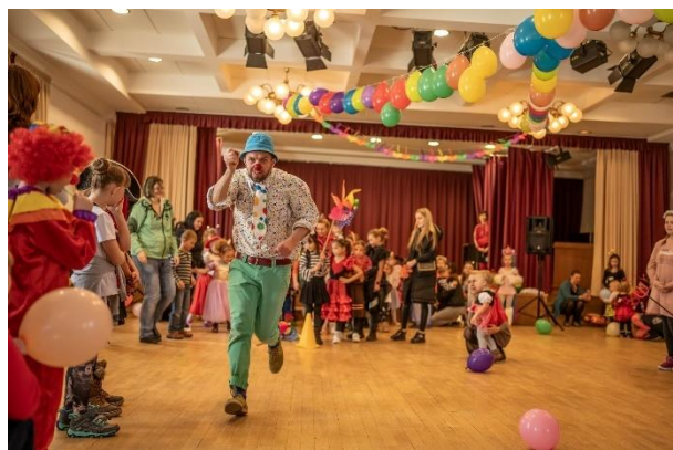
Karneval pro děti