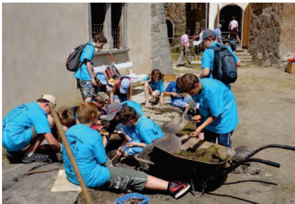
Obr. 7: SHaZ Bečov, doprovodné exteriérové programy Historie pod povrchem.

Řešení výše popsaných specifik a provozních problémů nalezla správa SHaZ Bečov právě v nabídce druhově odlišných prohlídkových tras a zapojení veřejnosti do procesu obnovy a neformálního vzdělávání 31 (obr. 7). Po dokončení stavební rekonstrukce uzavřené části areálu tedy nabídne Bečov plnohodnotnou interiérovou expozici v dolním zámku, volně přístupnou muzejně-galerijní expozici relikviáře sv. Maura v tzv. Pluhovských domech a lektorovanou interaktivní prohlídku středověkého hradu zaměřenou na stavební historii a technologii. Všechny trasy pak bude spojoovat interaktivní přístup a edukační programy. Návštěvník obou, pro běžné památkové objekty, atypických tras (muzejně-galerijní expozice relikviáře sv. Maura i středověkého hradu), bude mít příležitost – na základě zpracování expozice i lektorského vedení prohlídek hradu – historii a souvislosti zkoumaných památek samostatně objevovat a interpretovat.