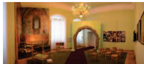
Obr. 2: SHaZ Bečov, stávající modernizovaná expozice relikviáře sv. Maura v dolním zámku. Foto: Lenka Svášková, 2011.

Od roku 1969 byl areál převeden do péče Krajského střediska státní památkové péče a ochrany přírody v Plzni (dnešní Národní památkový ústav, územní památková správa v Praze), vlastnické sjednocení se podařilo až v roce 1975. Krátce po převzetí areálu památkáři se začaly, díky dlouhodobě zanedbávané údržbě, projevat závažné stavební a statické problémy, většina budov se dostala do havarijního stavu. V souvislosti s majetkoprávním vypořádáním vlastnictví relikviáře ve prospěch památkového ústavu a s blízkým termínem dokončení náročného procesu jeho restaurování bylo rozhodnuto o jeho budoucí prezentaci v dolním zámku. Finální podoba rekonstrukce