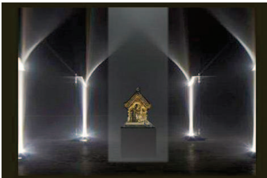
Obr. 6: SHaZ Bečov, vítězné řešení muzejní expozice Relikviáře sv. Maura – detail budoucí prezentace dominanty výstavy, SGL Projekt s.r.o., 2014.

soký stupeň vědeckého poznání zapříčiněný mimořádně náročným restaurováním. V neposlední řadě pak disponuje řadou velmi silných příběhů a širokým spektrem zajímavostí nadregionálního významu. 29