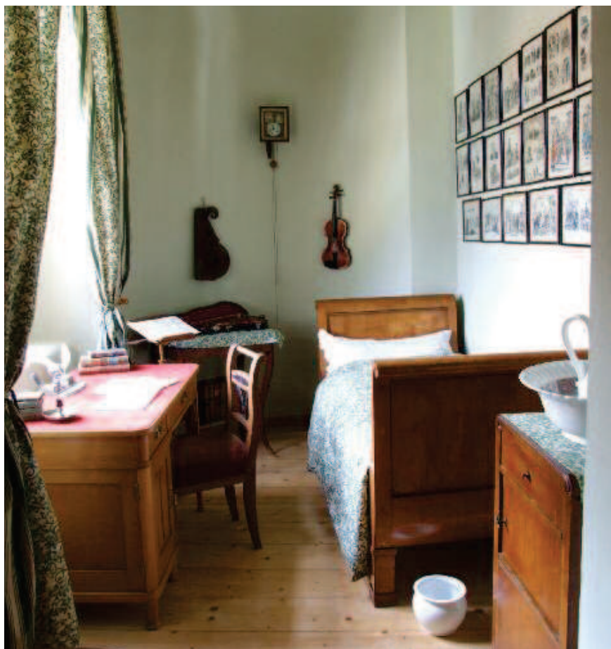
Obr. 4: SHaZ Bečov, pokoj zámeckého hudebníka, ukázka současného pojetí instalace interiéru dolního zámku.

11 Srovnej WASKOVÁ, Marie a WIZOVSKÝ, Tomáš. Cesta k poznání, zachování i využití kulturně-historického potenciálu horního hradu v Bečově nad Teplou. Zprávy památkové péče, 2007, roč. 67, č. 5, s. 403–404.