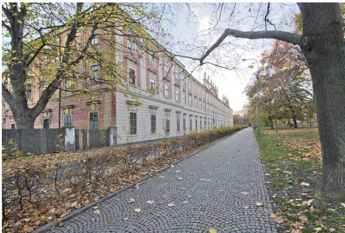
Téma 3, foto č. 2 – exteriér – pohled ze dvora, vlevo západní, v čele severní křídlo na západní křídlo