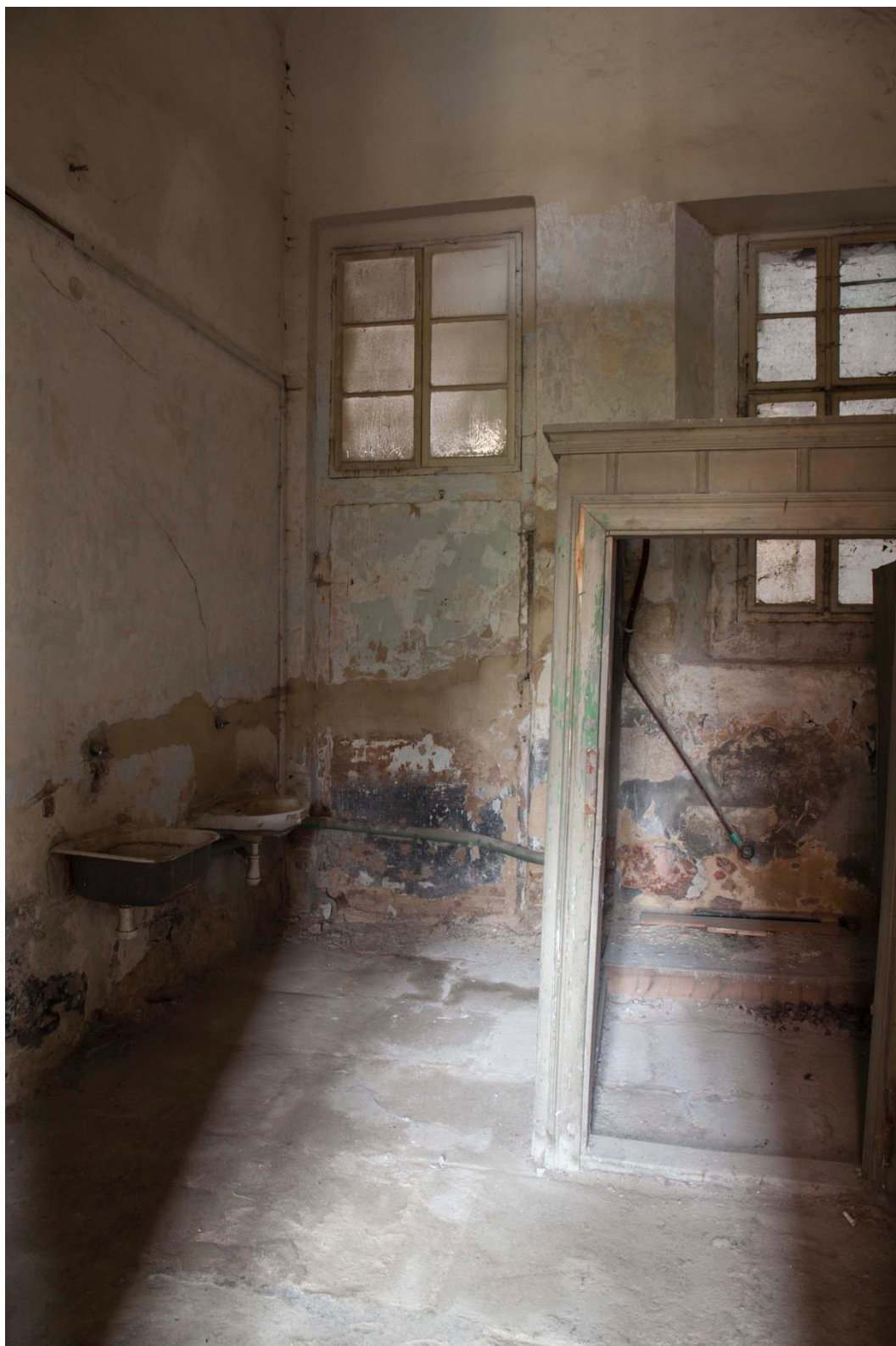
Téma 5, foto č. 1 – původní důstojnické toalety, západní křídlo, přízemí