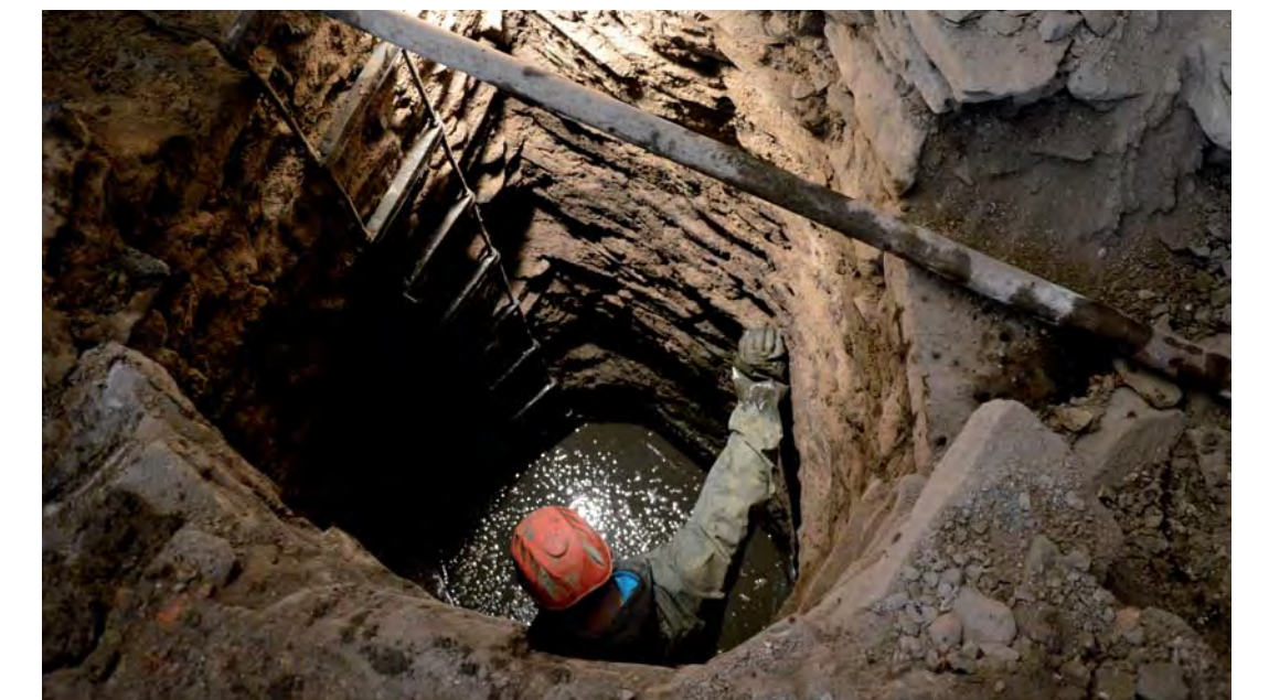
Průzkum kamenné studny.