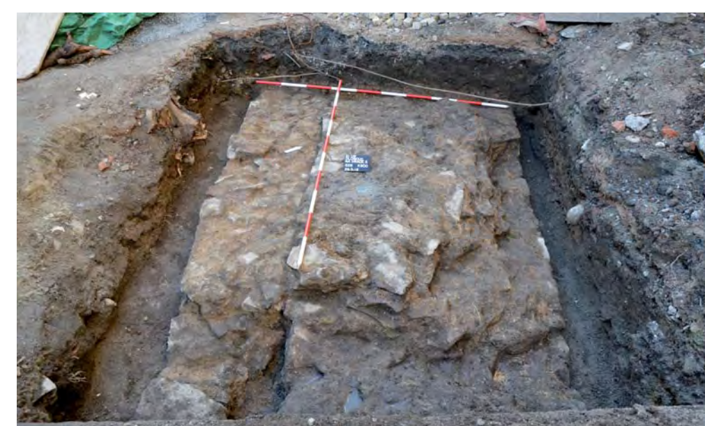
Jeden z úseků kamenné hradby tzv. Nového Hrádku.

Po polovině 13. století byl objekt Hrádku využíván pro potřeby olomouckého fojta; tím je také vysvětlen fakt náhlého „zmizení“ Hrádku z písemných pramenů. Velká změna nastala na počátku 14. století, kdy došlo k rozboření kamenné hradby a výstavbě nové budovy fojtství, pozdější zbrojnice, která byla zbořena až v 18. století.