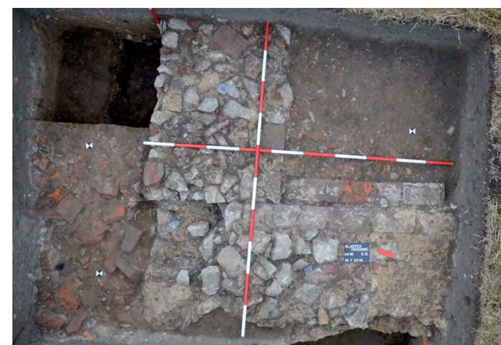
Zbytky zdi barokního letohrádku

Bývalá prelátská zahrada u hospodářského dvora kláštera Hradisko, pohled na zdivo severovýchodního křídla barokního letohrádku. srpen 2018