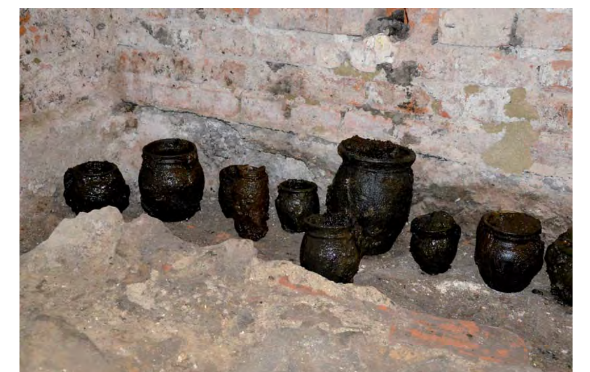
Středověké keramické nádoby ze studny.