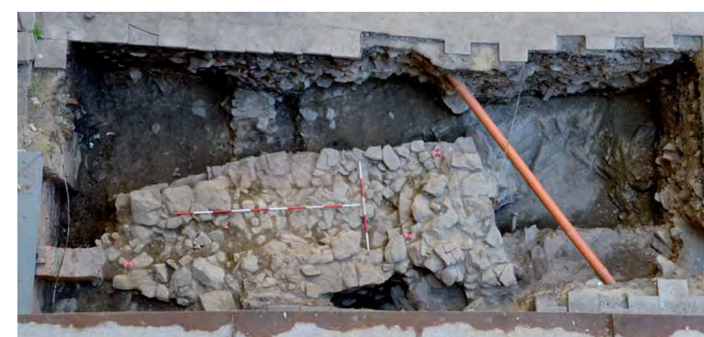
Torzo tzv. Juliánské věže.

zbytky zděného severovýchodního nároží, tzv. Juliánské věže, datované do 1. poloviny 13. století. Podle plánů ze 17. a 18. století se dají rozměry věže určit na přibližně 10 × 7,5 m. Patrně se tedy jednalo o obytnou věž. Na uvedených plánech je západně od Juliánské věže zobrazeno torzo další stavby, snad také věže, narušené budovou mladšího fojtství. V prostoru předzahrádky pak byla na několika místech zkoumána dva metry široká kamenná hradba, datovaná opět do 1. poloviny 13. století. Celý areál Hrádku opevněný kamennou hradbou měl rozměry zhruba 20 × 30 metrů a skládal se zřejmě ze dvou hranolových věží umístěných v zadní chráněné poloze. Tato hradní dispozice pak plně odpovídá hradům z 1. poloviny 13. století. Mezi přímými analogiemi lze zmínit moravský Buchlov a zejména jihočeský Landštejn.