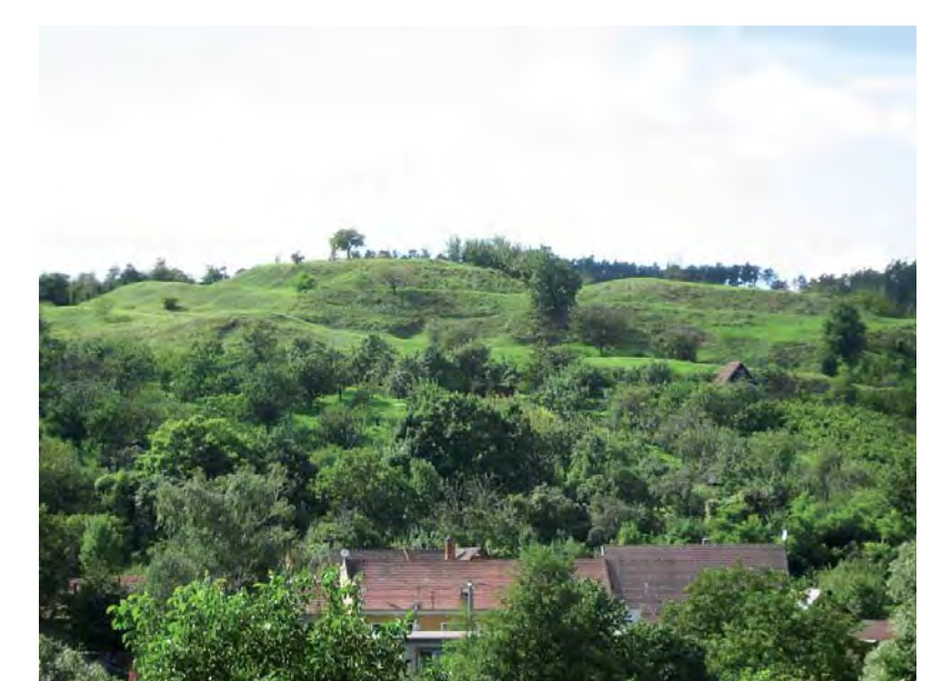
Petr Vitula, NPÚ, ÚOP v Brně

Ve většině případů tvrze doprovází i druhý typ památek raně a vrcholně středověkého stáří, a to vesnice, které buď ještě ve středověku či v novověku zanikly a už nikdy nebyly obnoveny, nebo si udržují kontinuitu osídlení až dodnes. Proto se také jejich počet nijak výrazně neliší od počtu sídel drobné venkovské šlechty.