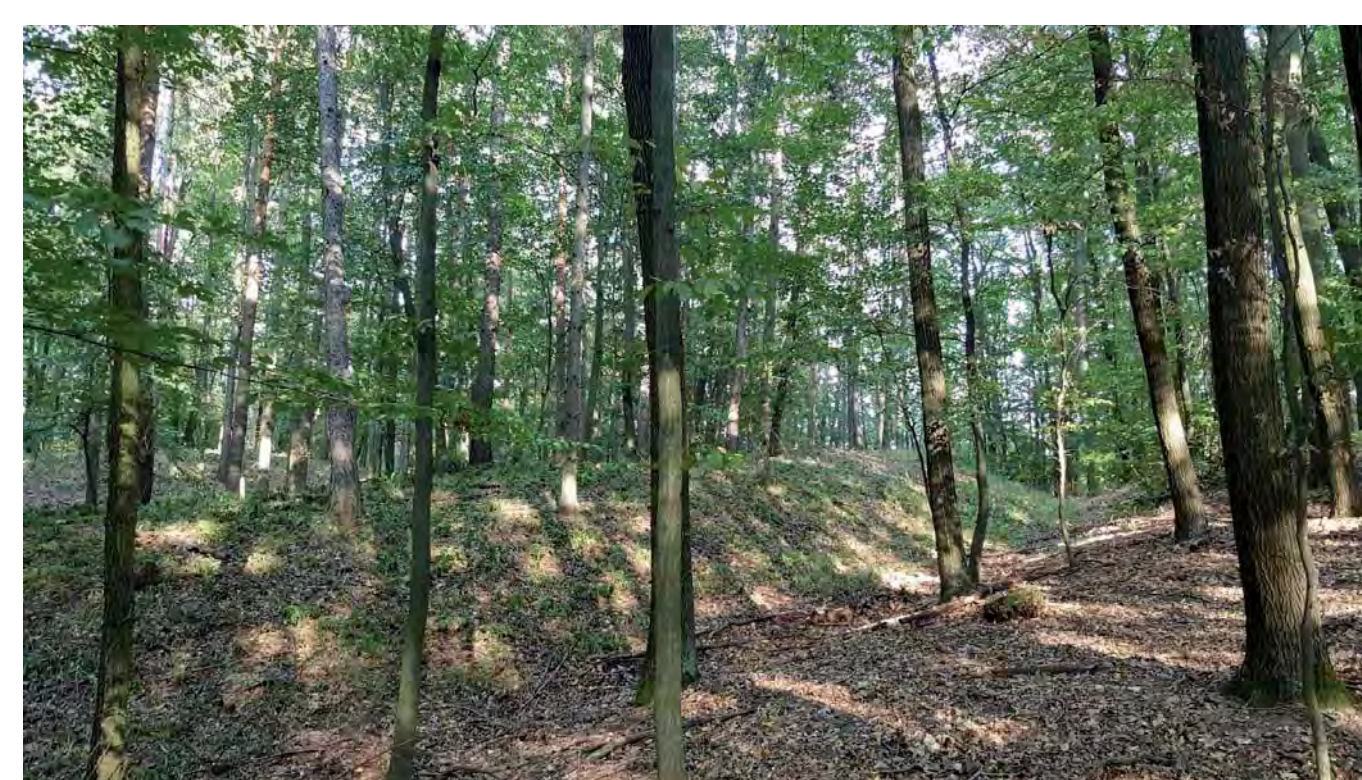
Terénní pozůstatky opevnění hradiště u Ždánic

tvaru nepravidelného oválu o max. rozměrech 140 × 80 m obepínal val a na přístupné straně zdvojený příkop. Značnou část někdejšího opevnění ve východních a severovýchodních partiích porušuje lesní cesta.