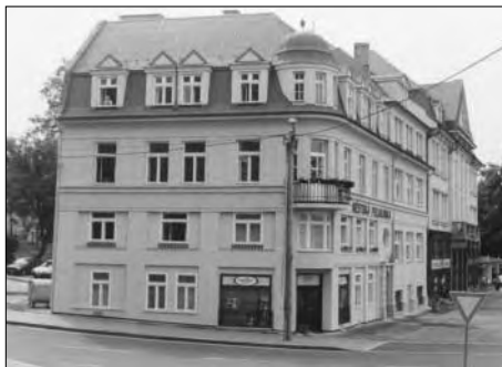
Orlová – Město, Staré nám. čp. 91, stav objektu po celkové rekonstrukci v roce 2002.

V ochranném památkovém pásmu Havířov byla realizována kvalitní oprava Kulturního domu Petra Bezruče kontinuálně probíhající od roku 2001, kdy byl upraven exteriér včetně nových břizolitových omítek. Letos se stavební činnost plně soustředila na interiér a přilehlé okolí s terénními úpravami, dosadbou zeleně a výměnou nevyhovujícího městského mobiliáře. Zásadní rekonstrukce zpevněných ploch se však udála v centrální části města – na náměstí Republiky s přilehlou ulicí Dělnickou a Národní třídou, kdy byly upravovány nevyhovující živící pokryté pochůzí plochy, včetně generální opravy stávajících inženýrských sítí a rozmístěn inovovaný městský mobiliář.