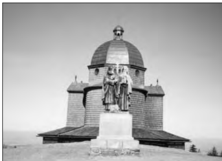
Dolní Bečva, nová krytina kopule kaple sv. Cyrila a Metoděje na Radhošti, 2002.

K dalším sledovaným akcím se řadí dokončení výměny vadných částí krovu a střešní krytiny kopule kaple sv. Cyrila a Metoděje na Radhošti, sanace kostela sv. Kateřiny v Zubří nebo přístavba v areálu speciální školy pro sluchově postižené ve Valašském Meziříčí.