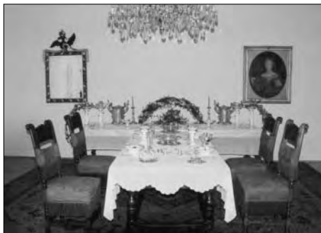
Zámek Hradec nad Moravicí, Vánoce na zámku v roce 2002, pohled do Hubertovy světnice.