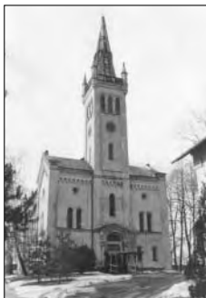
Suchdol nad Odrou, evangelický kostel, rejstř. č. 52005/8-4062, prohlášeno 17. 6. 2002.