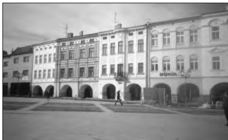
MPZ Místek, náměstí Svobody po rekonstrukci, květen 2002.

a pokračuje rekonstrukce předsálí a Zlatého salonku. Byl zde proveden restaurátorský průzkum, při kterém byly nalezeny renesanční malby. Mimo MPZ probíhají práce na obnově dvou kulturních památek na Slezské ulici – barokního hostince čp. 1079 a secesní vily čp. 763. V MPZ Brušperk byla opravena fasáda domu čp. 12 na Komenského náměstí a rekonstrukce dvorního traktu domu čp. 22 – městský úřad. Na Hukvaldech probíhají práce na obnově kulturní památky – rodného domu L. Janáčka. Byla provedena rekonstrukce krovu, oprava a nátěr fasády.