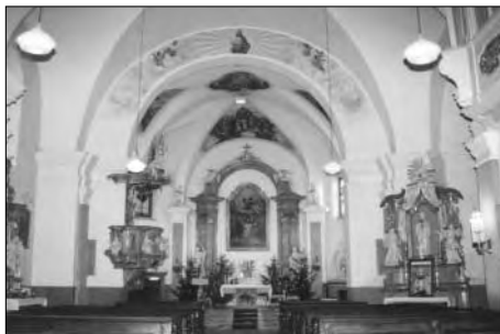
Valašské Meziříčí, farní kostel Nanebevzetí Panny Marie, pohled z hlavní lodi k oltáři. Orlová, kostel Narození Panny Marie, schodiště a detail průčelí.