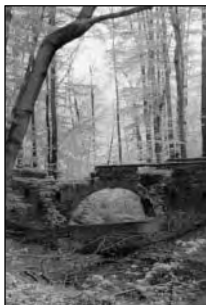
Dobroslavice, okres Opava, havarijný stav můstku v parku.