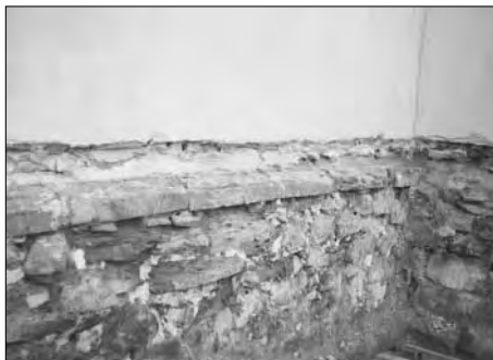
Moravská Ostrava, Kostelní náměstí, kostel sv. Václava – nález původních římsovek soklu, 2002.