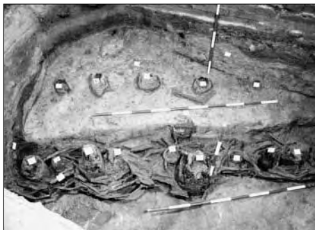
Opava – náměstí Osvoboditelů (akce č. 17/2). Zpevnění břehu tzv. mlýnského náhonu, 16. – 17. století. (foto: Jiří Juchelka).

kteří vznikaly při výstavbě a rekonstrukci inženýrských sítí. Opět bylo zjištěno pod nejstarší úpravou povrchu ulice štětováním několik sídlištních jam s nálezy ze 13. – 14. století.