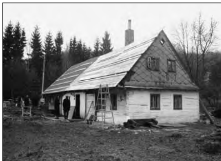
Malá Morávka, čp. 113, celková rekonstrukce objektu (foto: archiv SPU v Ostravě).

Nejvýznamnější akcí roku 2002 je bezesporu završení několikaleté obnovy a dnes veřejnosti zpřístupnění tzv. Schindlerovy stodoly v centru obce. Jedná se o architektonicky výjimečnou celodřevěnou hospodářskou stavbu s lamelovou střechou, která bude sloužit jako víceúčelové kulturní zařízení. Z památkového hlediska je daleko méně úspěšnou akcí obnova chalupy čp. 155, kde došlo k celkové výměně krovu a roubení. Obnova a zachování staletých dřevěných konstrukcí patří mezi nejčastěji řešenou problematiku, stejně jako zajištění budov. Statické poruchy se nejčastěji projevují na kostelech, které díky dlouhodobé neúdržbě jsou často v celkovém havarijním stavu. Při jejich záchraně je nezbytné v první řadě objekt staticky stabilizovat a zamezit zatékání. Velikost těchto staveb je přímo úměrná výšce vynaložených financí na obnovu. V roce 2002 probíhaly tyto akce: