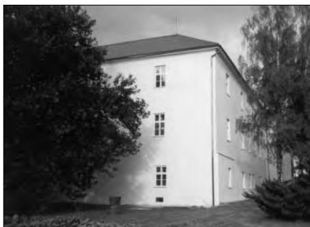
Zámek v Klimkovicích po opravě fasády.

V Klimkovicích pokračovala oprava fasády zámku. Oprava spočívala v odstranění nevhodné cementové omítky, která byla nahrazena hladkou štukovou omítkou, sledující nerovnosti historického zdiva. Bylo provedeno odvodnění objektu a okapní chodník z přírodního kamene.