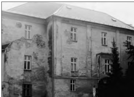
Zámek v Klimkovicích před opravou fasády.