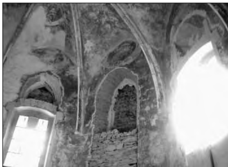
Staré Město u Bruntálu, kostel Neposkvrněného početí Panny Marie, odkryté gotické malby v interiéru sakristie (foto: Michaela Pflugrová).

náhonu) proběhla projektová příprava na řadu akcí dalších, připravovaných pro rok 2003.