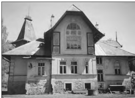
Malá Morávka, vila čp. 44, tzv. zámček. Vila z roku 1909 - 1910 s dochovanými kvalitními secesními prvky a zajímavě řešeným exteriérem s použitím hrázděného zdiva. Rejstř. č. 8-4066, prohlášeno 27. 6. 2002.