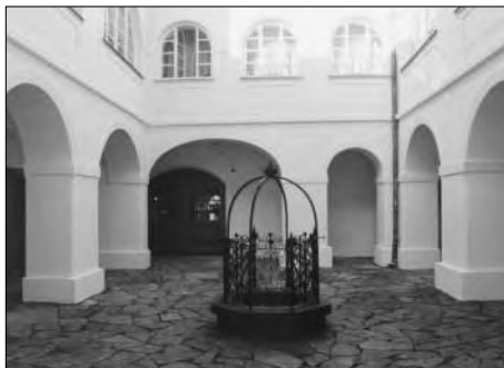
Velké Heraltice, druhé nádvoří zámku, po rekonstrukci v roce 2002.

Asi nejrozsáhlejší stavební obnovou pro následující roky na Opavsku bude celková oprava zámku ve Štáblovicích. V letošním roce probíhala průběžná příprava projektové dokumentace, restaurátorský a záchranný archeologický průzkum. V druhé polovině roku se přistoupilo k částečné realizaci první etapy obnovy, která spočívala ve statickém zajištění objektu, respektive ve ztužení nestabilního podloží pomocí mikropilotáží a dále ke zpevnění základů.