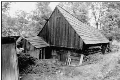
Karolinka – Račkov, stodola u čp. 285, červen 2002.