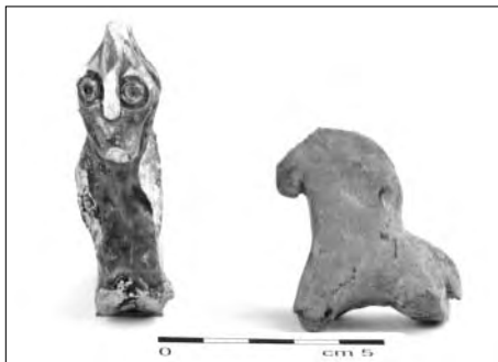
Opava – Pekařská ulice 11 (akce č. 6/02). Drobná keramická plastika, 13. – 14. století (foto: Tomáš Ott).

Náročnou akcí, zajišťovanou zčásti smluvním externistou, byl záchranný výzkum, spojený s rekonstrukcí Masarykova náměstí v Karviné – Fryštátu. Ve výkopech pro inženýrské sítě bylo na řadě míst dokumentováno souvrství komunikačního charakteru a několik zahluobených objektů. Ty se soustřeďovaly zejména v prostoru před zámekem, tedy v místě středověkých městíšť, ojedinělé zahluobené objekty byly odkryty i ve vlastní ploše náměstí. Přední místo mezi nimi zaujímal rozsáhlý, pouze částečně zkoumaný objekt obdélného půdorysu s dvojitou dřevěnou stěnou, který lze interpretovat jako nádrž na vodu. Substrukci zdíva, zachycenou v jeho blízkosti, je možné považovat za pozůstatky kašny. Kromě těchto novověkých objektů se podařilo místy zachytit i starší situace s nálezy z přelomu 13. a 14. století.