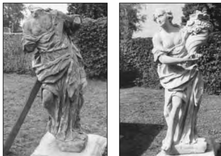
Neplachovice, park, socha mytologické bohyně Flóry, stav před restaurováním a po restaurování, 2002 (foto: MgA. akad. sochař J. Gajda).