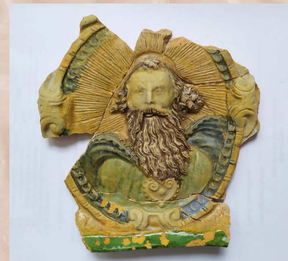
Dochované fragmenty renesančních majolikových kamen nalezené při archeologickém výzkumu na nádvoří zámku Český Krumlov. Sbirka Regionálního muzea v Českém Krumlově