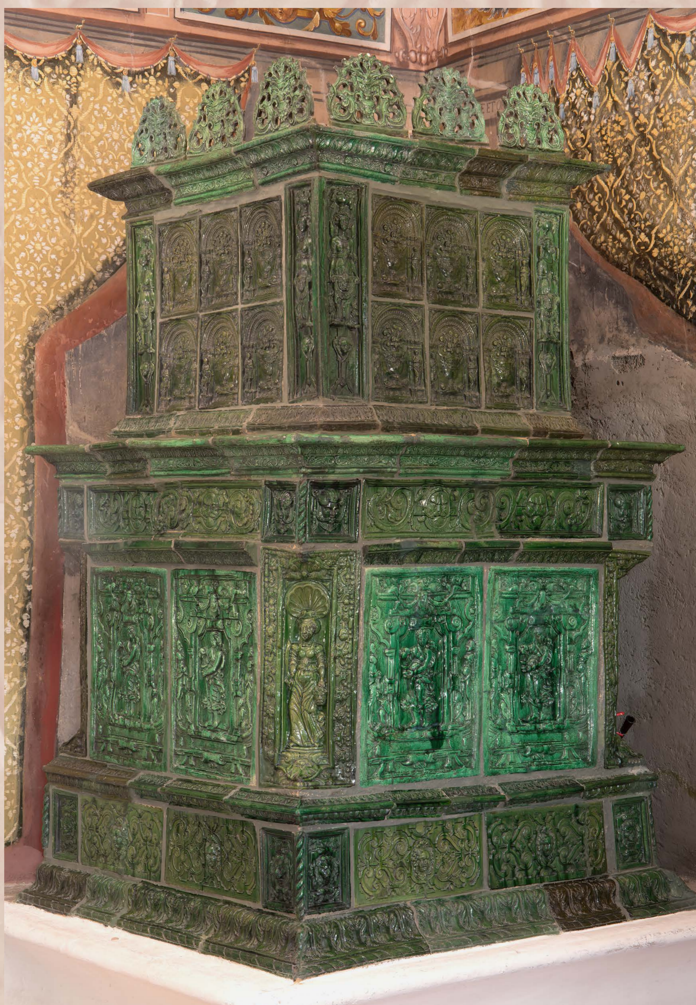
Renesanční zelená kamna, SH Rožmberk