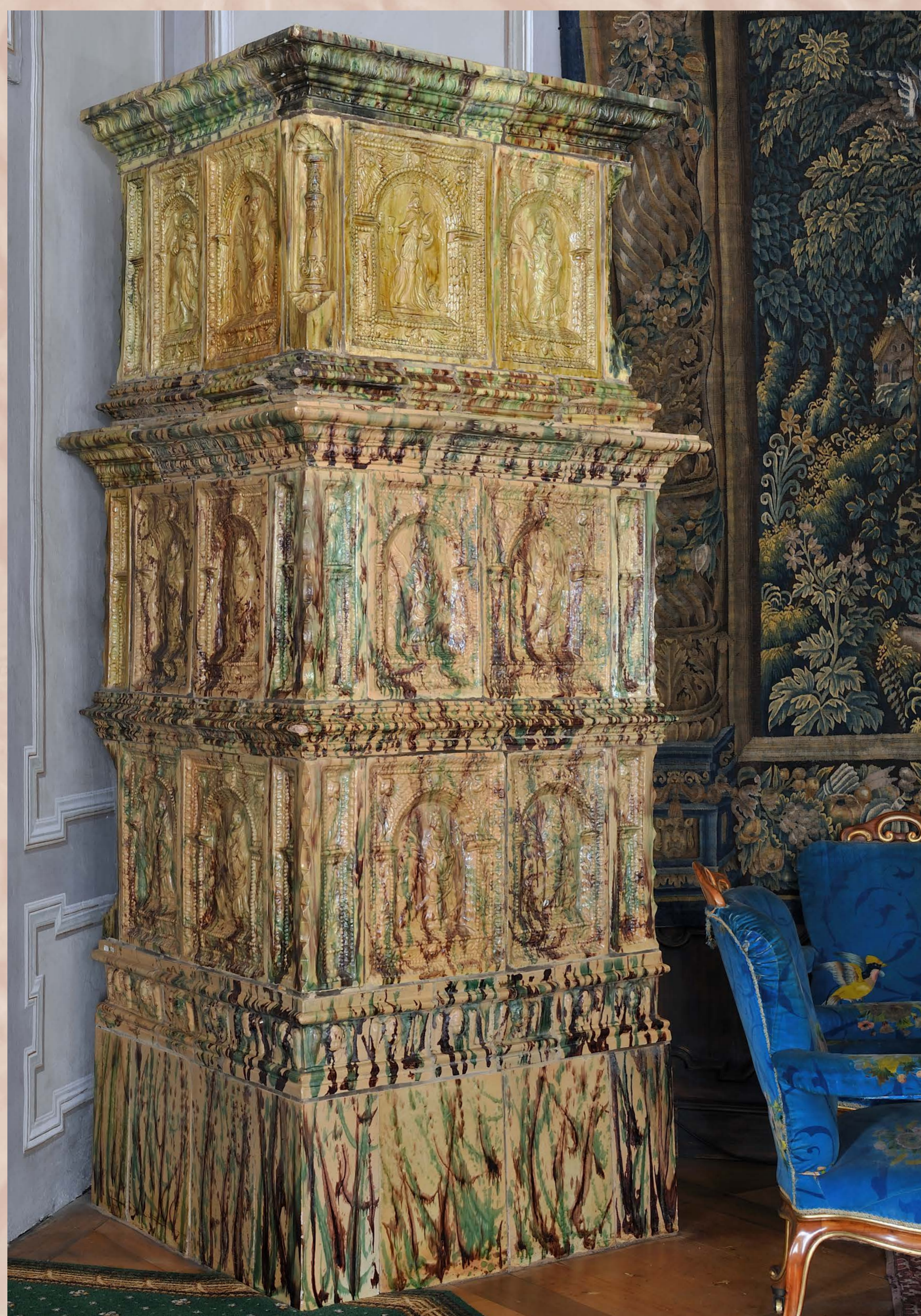
Hranolová tupovaná kamna s reliéfy andělů, světic a hlavami andlíků, SHZ Český Krumlov