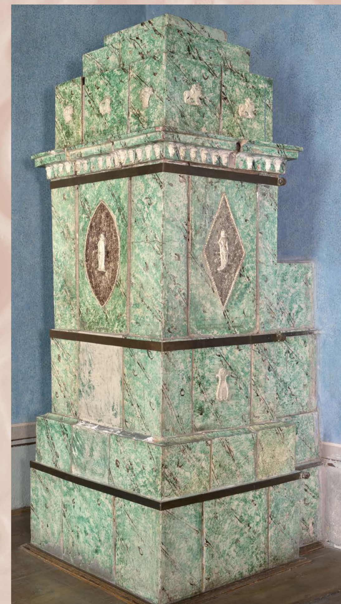
Zeleně mramorovaná (tupovaná) klasicistní kamna s plastickým dekorem, 19. století, SHZ Jindřichův Hradec