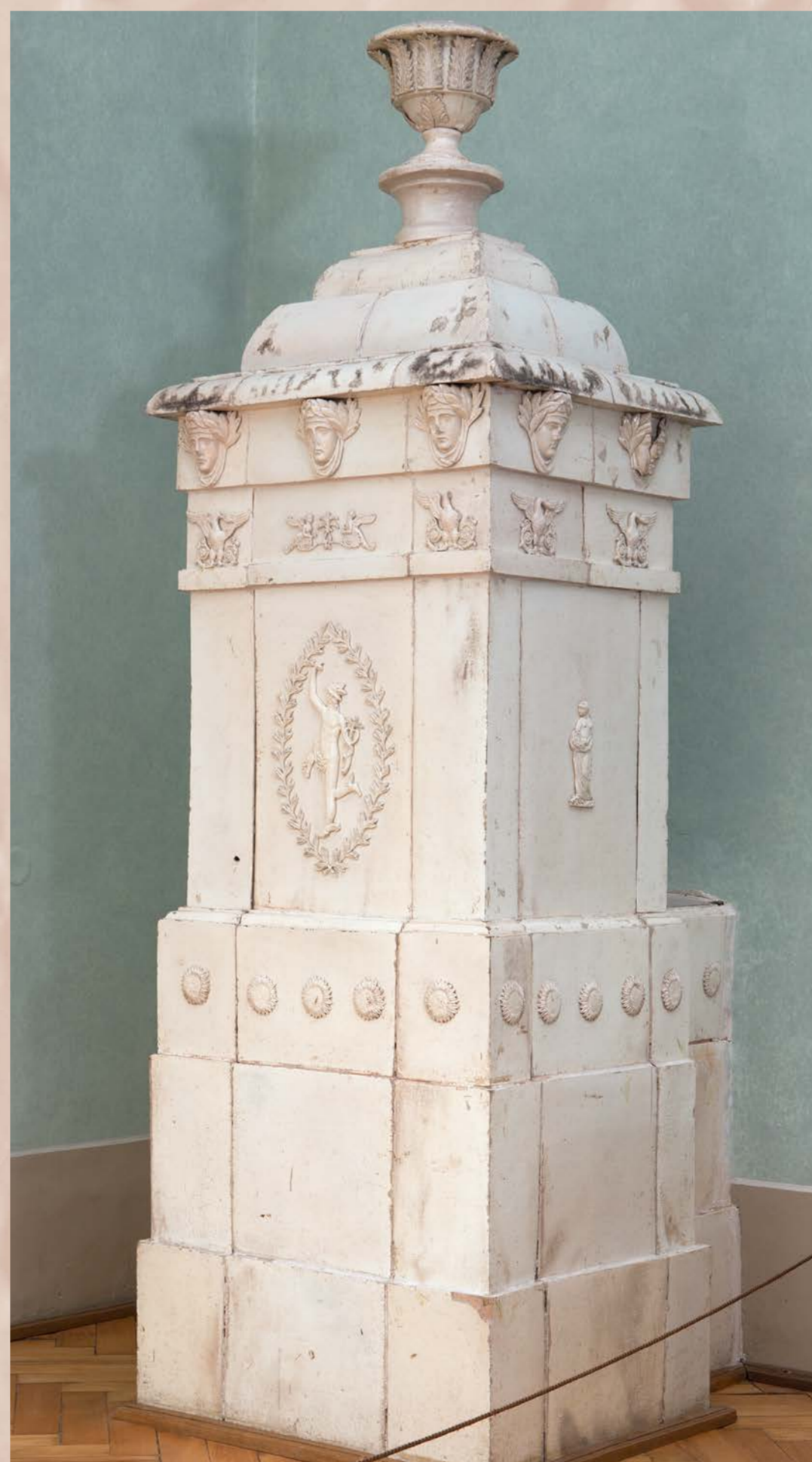
Bílá klasicistní hranolová kamna s jemným reliéfním dekorem, 1790–1840, SHZ Jindřichův Hradec