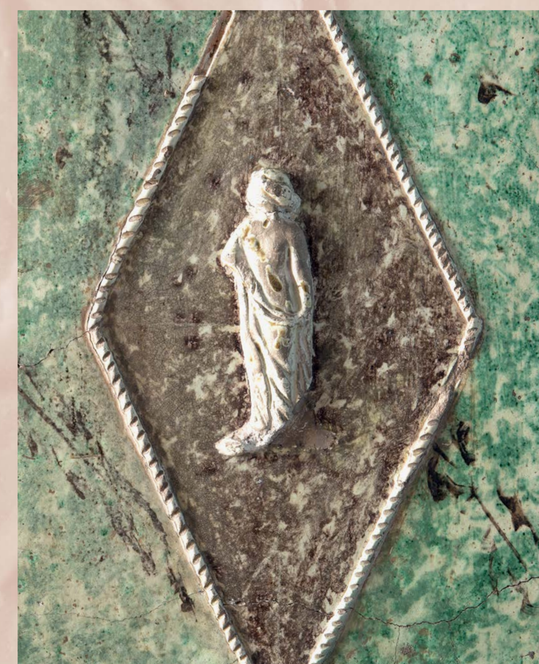
Detail plastické výzdoby s antickými motivy, SHZ Jindřichův Hradec