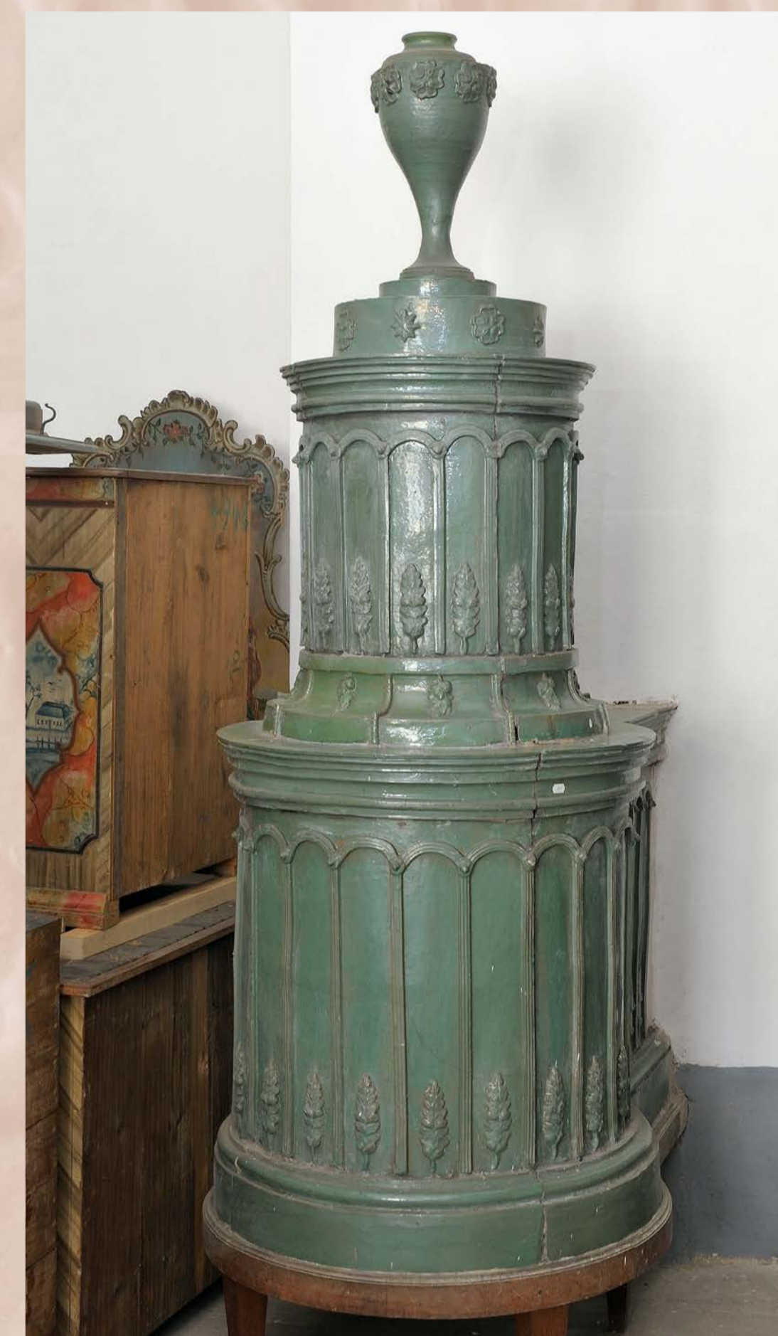
Zelená kamna zdobena oblouky a štíhlou vázou, 1800–1840, SHZ Český Krumlov