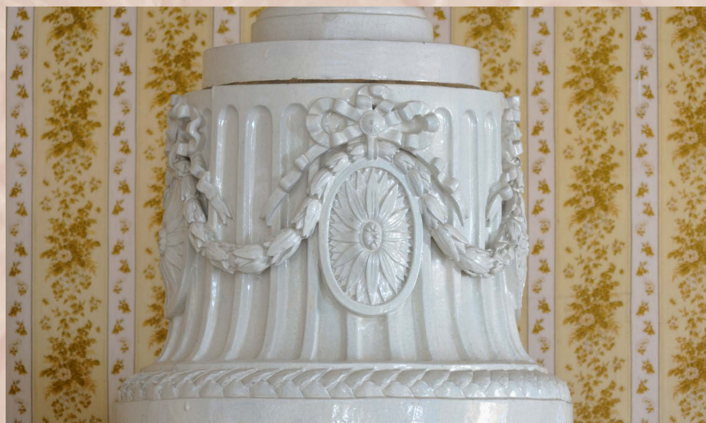
Detail výzdoby empírových kamen, rozeta, vavřínový feston s mašlí, SHZ Český Krumlov