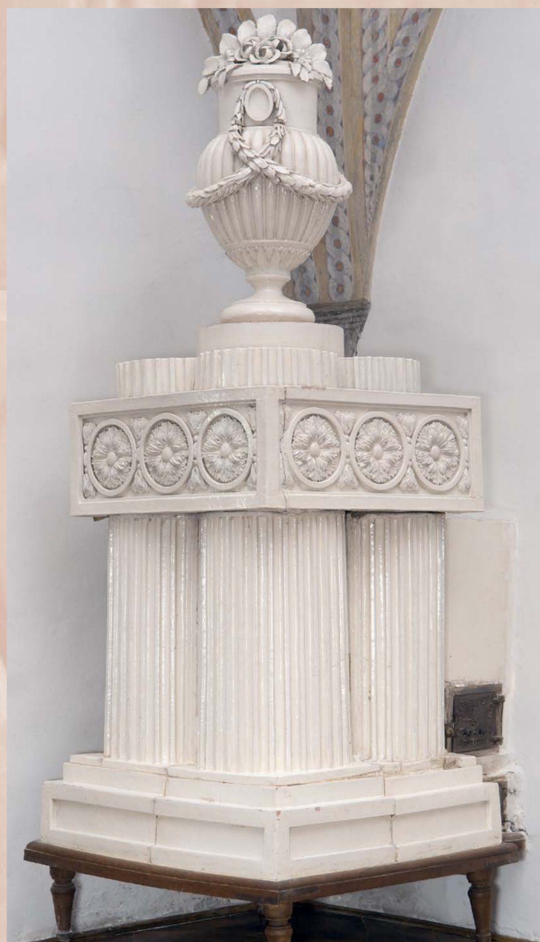
Bílá empírová kamna tvořená čtyřmi spojenými kanelovanými válci s vázou na vrcholu byla ze zámecké kaple v Jemčině převezena v roce 1917 na zámek Jindřichův Hradec, SHZ Jindřichův Hradec

Klasicistní kamna byla velmi často zdobena stříkáním nebo foukáním. Často užívaná byla také technika trasakování, neboli mramorování, kdy byla na povrch kachle pokrytého základní vrstvou nástřepí nanášena před jejím ztuhnutím kukačkou další jedna nebo více vrstev barevné hlinky jiné barvy. Další technikou bylo tzv. trlinkování nebo-li krakelování a také tupování. Povrch kachle pokrytý základní hlinkou byl „tupován“ – dekorativně narušen – pomocí houby nebo smotku látky. Flamováním byla na povrch kachle pokrytého glazurou pomocí kukačky, štětcem nebo kartáčem nanášena glazura jiné barevnosti. Po barevné úpravě kachle byl na povrch nalepen nízký, jemný, z formy vytlačený reliéf ze světlé hlíny s motivem stylizovaných antických postav, ornamentů, květin. Po nalepení reliéfu, který měl zůstat oproti podkladu odlišně, většinou bílé barvy, se už další dekorování neprovádělo. Trasakování, stříkání a tupování byl proces prováděný u reliéfně zdobených kachlů ještě před nalepením reliéfu.