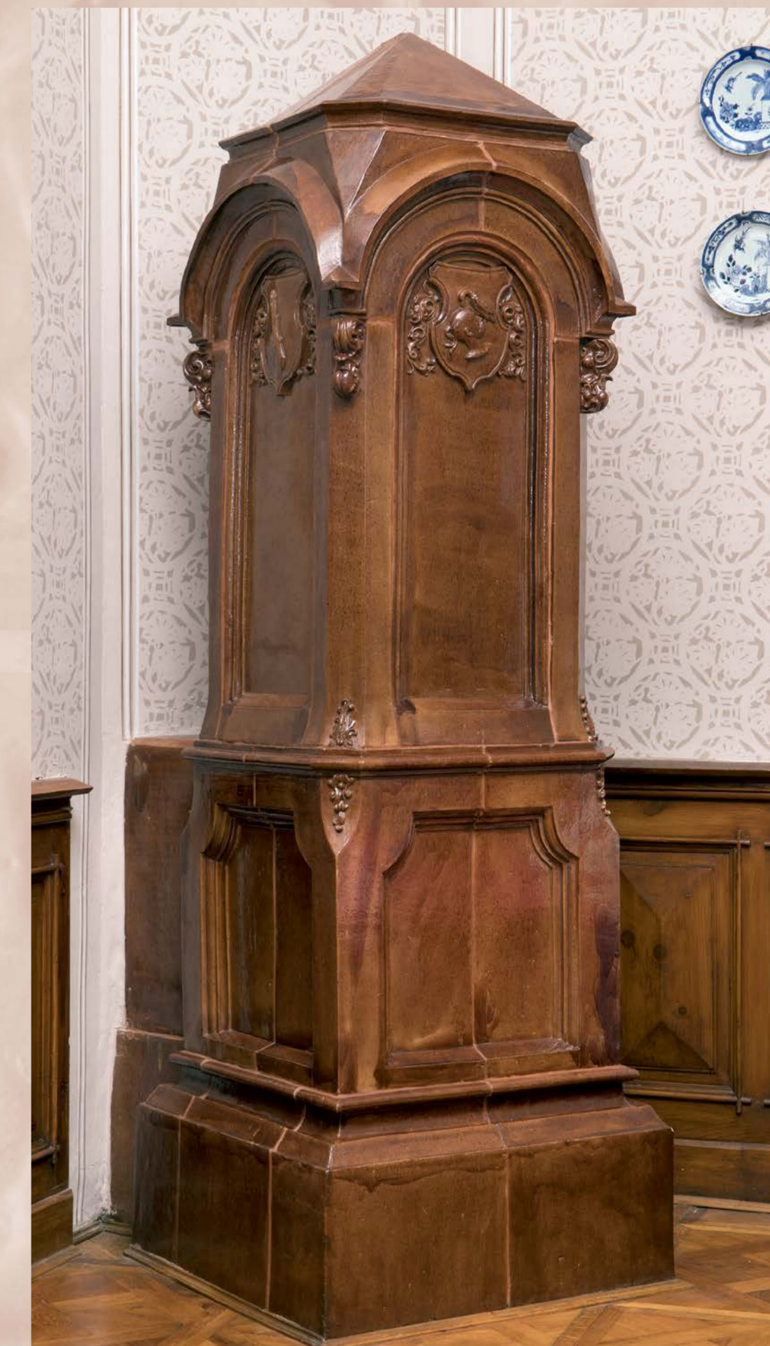
Soubor nových krbů a kachlových kamen, který měl zajistit dostatečné vytápění v pokojích zámku Hluboká, byl vyroben podle návrhů od neznámého kamnáře (architekta). Obsahují poznámky k barvě, velikosti, počtu i umístění. Kachlová kamna s gotickými výtvarnými prvky byla vyrobena nejvíce ve dvou kusech, většinou v zelené a hnědé barvě, SZ Hluboká