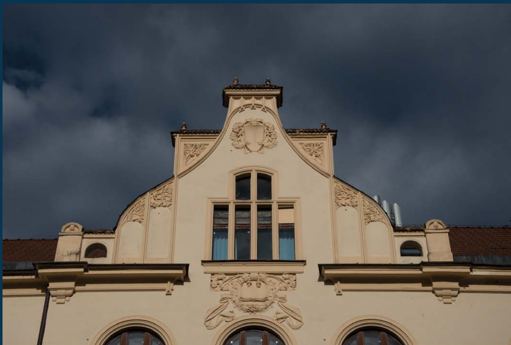
Obchodní akademie na Husově třídě; foto Jakub Drozda, 2023

tradiční vertikální okno (na výšku) v obležení ornamentu