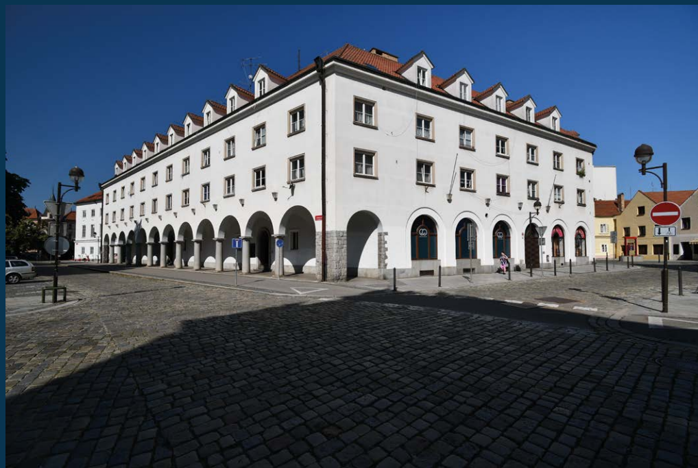
Herecké domy; foto Jakub Drozda, 2023

herecké domy (1941-43) ve svých čistých liniích skrývají zjednodušenou citaci klasické architektury, podpořenou přízemními arkádami, za které by se nemusel stydět kdejaký italský renesanční palác