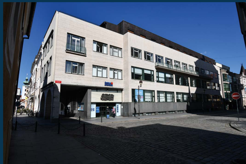
Českobudějovická záložna

českobudějovická záložna (1934-36) je ve svých jednoduchých formách (rozuměj tvarech) naplno otevřena novým proudům architektury a necituje tu klasickou