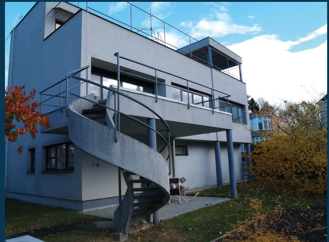
Švecova vila; foto Eva Erbanová, 2006

zcela nový způsob komponování domu s Hardt- muthovou vilou kontrastuje třeba plochou střechou