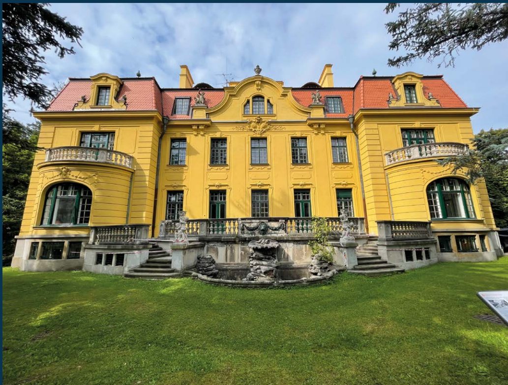
Hardtmuthova vila; foto Jana Štorková, 2021

v minulosti již mnohokrát použité tvary a formy (např. šikmá střecha s vikýři)