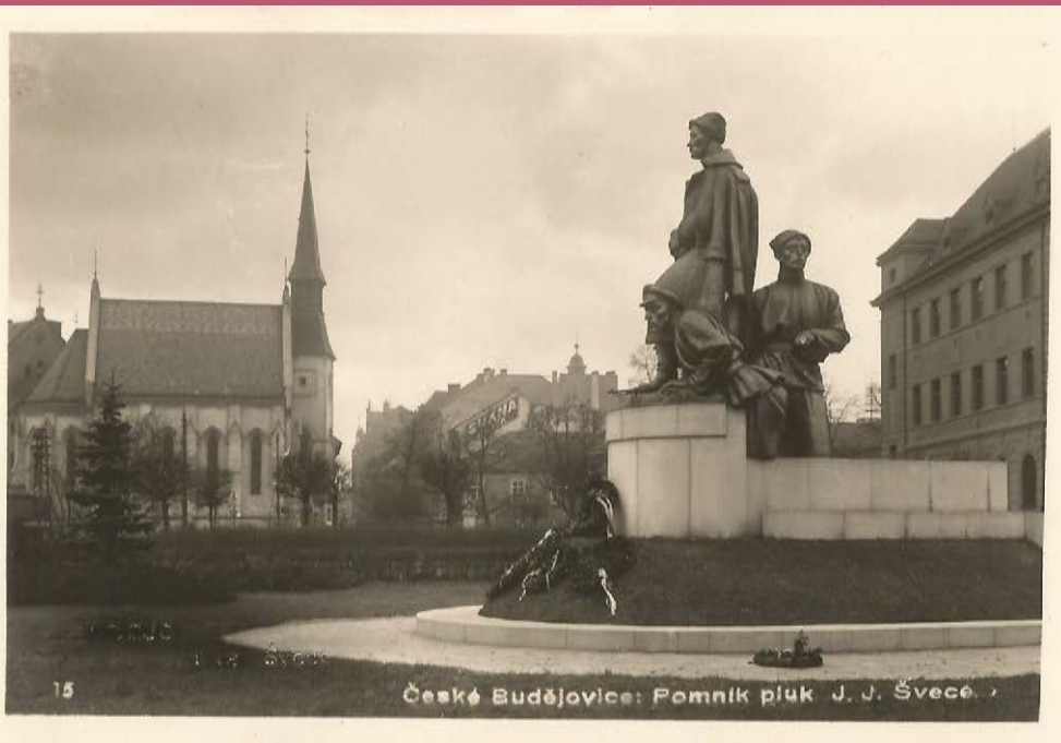
Dnes již neexistující Švecův pomník na Senovážném náměstí; pohlednice z 30. let 20. století

pomníky – umělecká díla, která mají společenský a politický význam, protože veřejně připomínají vybrané osoby a události. v dobách velkých změn často dochází k jejich odstraňování nebo nahrazování.