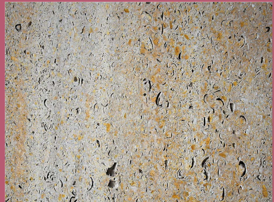
Nové krematorium; foto Jakub Drozda, 2021

různé druhy kamene, používané pro obklady fasád nebo interiérů, mohou svou strukturou vytvářet pozoruhodný výtvarný efekt