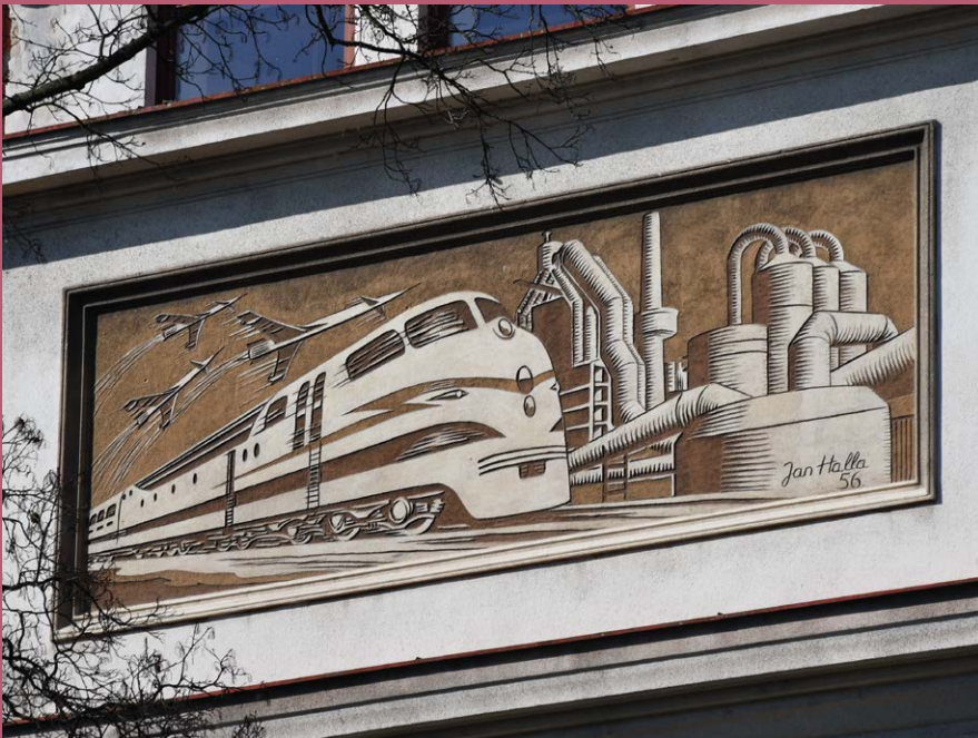
Průmyslová škola; foto Jakub Drozda, 2023

z umění se ve 20. století zcela neztrácí ani starší tradiční techniky – např. sgrafito (výzdoba omítky proškrabáváním)