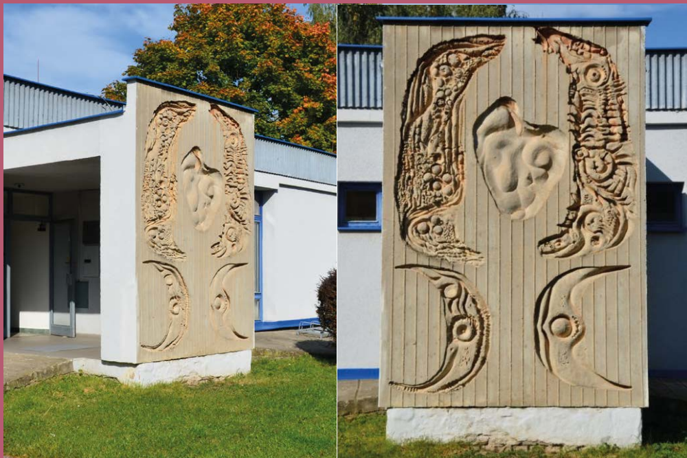
Ladislav Konopka, reliéf na Domu s pečovatelskou službou, Voříškov Dvůr; foto Jakub Drozda, 2017

realistické umění – na první pohled je nám jasné, co umělec zobrazuje, protože se snaží co nejpřesněji napodobit skutečnost (realitu)