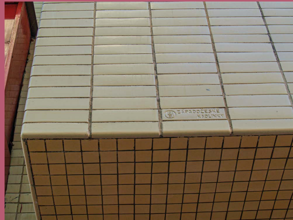
Obchodní dům Brouk a Babka

keramické dlažky oděly i budovu obchodního domu B+B, jejich struktura nahrazuje tradiční ornament známý ze starších budov a nažloutlá krémová barva nenásilně doplňuje červené rámy pásových oken