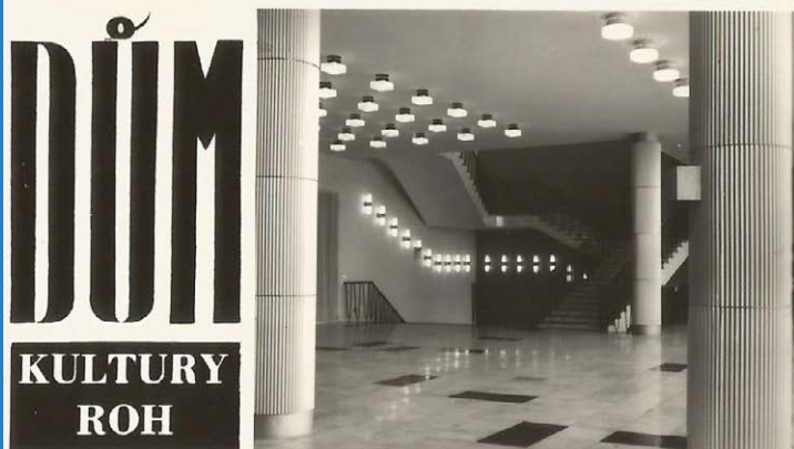
pohlednice z roku 1968