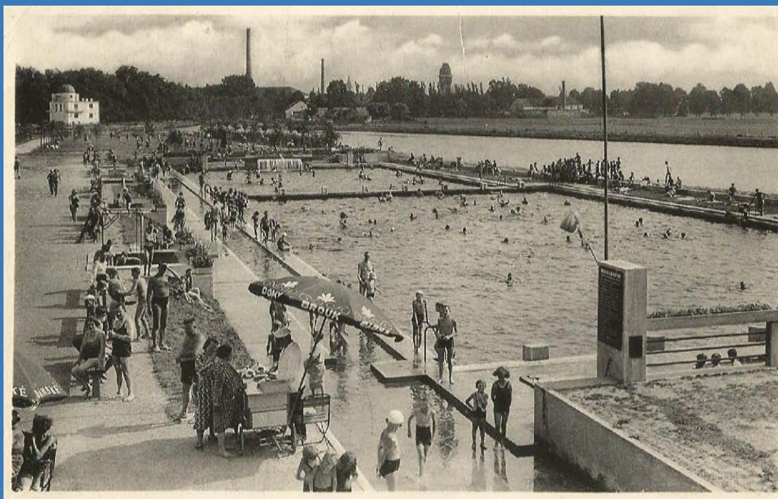
Sokolský ostrov, původní podoba letní plovárny; dobová pohlednice z 30. let

dobový letecký pohled ilustruje, jak důmyslné a stoprocentně věnované volnému času bylo rozvržení Sokolského ostrova – nabízí hned několik sportovních zón (hřiště, bazén, stadion)