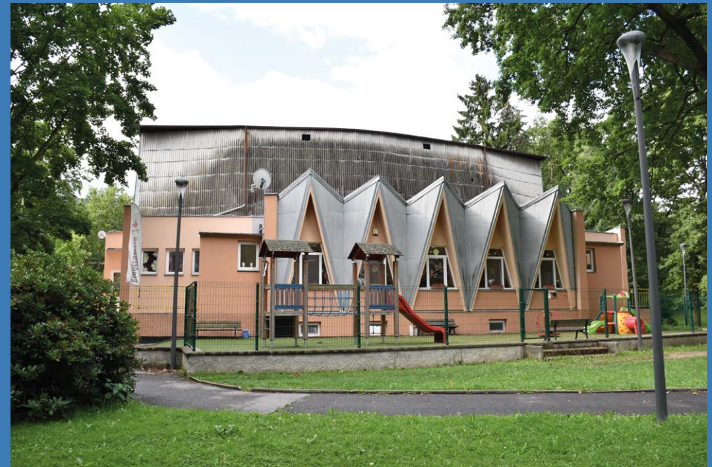
Bývalá restaurace letního kina v Háječku; foto Jana Štorková, 2021