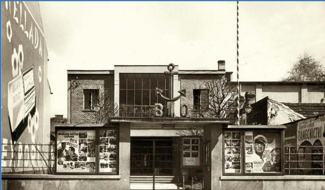
Kino Kotva na Lidické; dobová pohlednice ze 30. let

restaurace kina v Háječku je jedním z nejkvalitnějších představitelů tzv. bruselského stylu, architektura se tady zcela podřizuje své funkci, sál restaurace totiž skrze velká okna rámovaná téměř až avantgardními štíty střech doslova komunikuje se vnějším prostorem veřejného parku