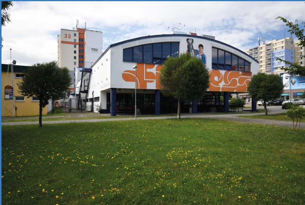
Fitness centrum Pouzar

architektura ve službách volného času našla své místo především mimo historické centrum města. zónu kolem soutoku tak mimo Sokolský ostrov doplnila i dvojice budov – hvězdárny a později planetária, které odrážely zájem o vědu a pomyslné dobývání vesmíru.