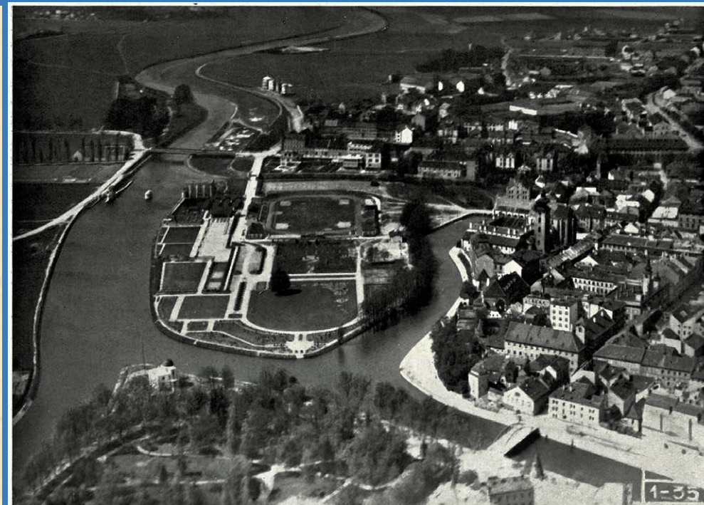
Sokolský ostrov