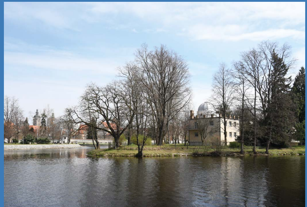
Hvězdárna a planetárium; foto Jakub Drozda, 2023