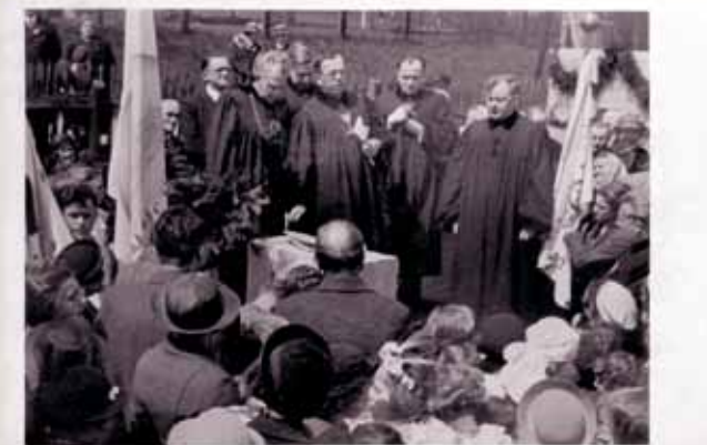
Uroczystość położenia kamienia węgielnego z udziałem biskupa Stanislava Kordulego w dniu 8 maja 1938

rozwiązywany w kombinacji z obkładem ceglanym. Pozostałe dwa projekty nie posiadały monumentalności i autorskiej inwencji twórczej. W lutym 1938 mieszkańcy Podmoklic podnieceni też częścią rady miejskiej wzniesli liczne protesty przeciwko powstaniu nowego rynku i umieszczenia zboru w jego centrum. Bezwyjściową sytuację pomogła rozwiązać aż wymiana parceli z Annou Bobkovou. Zaoferowana parcela w pobliżu trasy kolejowej była mniej odpowiednia na budowę zboru, jednak w danej sytuacji było to jedynym możliwym rozwiązaniem. Uroczyste położenie kamienia