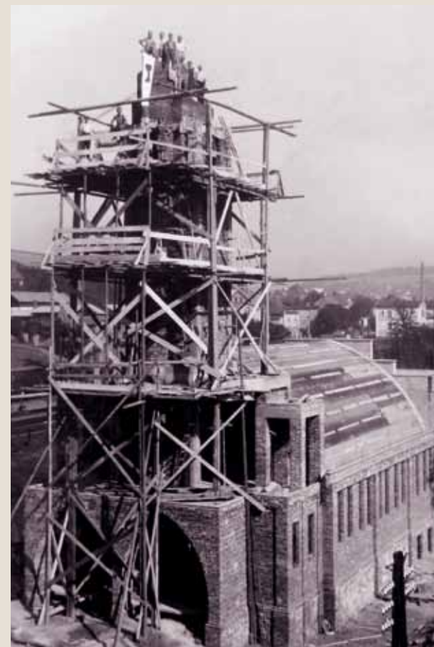
Zakończenie budowy wieży zboru, lato 1938go roku