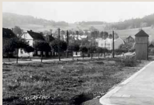
Dzwonnica CZK zbudowana w roku 1932 w miejscu zaplanowanej budowy zboru