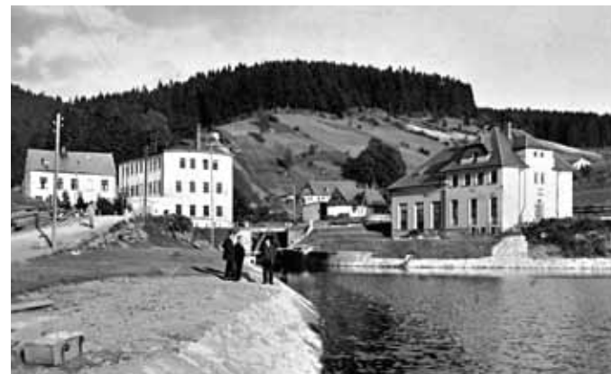
Elektrárna po napuštění vyrovnávací nádrže. Vlevo od mostu továrna Alexandra Spitze. Na svahu je patrná trasa tlakového potrubí, asi 1928