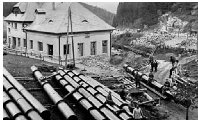
Přírubové nýtované tlakové potrubí připravené k montáži. Vlevo elektrárna Rudolfov I, vpravo prostor budoucí vyrovnávací nádrže, zcela vpravo část kamenolomu otevřeného pro potřeby stavby, 1926

Přivaděč začíná odběrným objektem s hrubými česlemi nedaleko podhrází bedřichovské přehrady. Přes tři kilometry dlouhý přivaděč vede lesním terémem a tvoří jej krytý kanál profilu U z prostého betonu (v místě dvou akvaduktů ze železobetonu), široký 1 m a ve středu vysoký 1,23 m. Kromě vlastního kanálu, svrchu krytého betonovými deskami zaspanými zeminou, bylo nutné postavit dvě nádrže k zachycování splavenin z levostranných přítoků přivaděče – v těchto místech je veden krátkými akvadukty. Beztlaková část přivaděče končí ve vodním zámku s vyrovnávací komorou, odkalovací propustí, jalovým přepadem a jemnými česlemi. Odtud směřuje tlakové potrubí k elektrárně, zprvu nad úroveň terénu