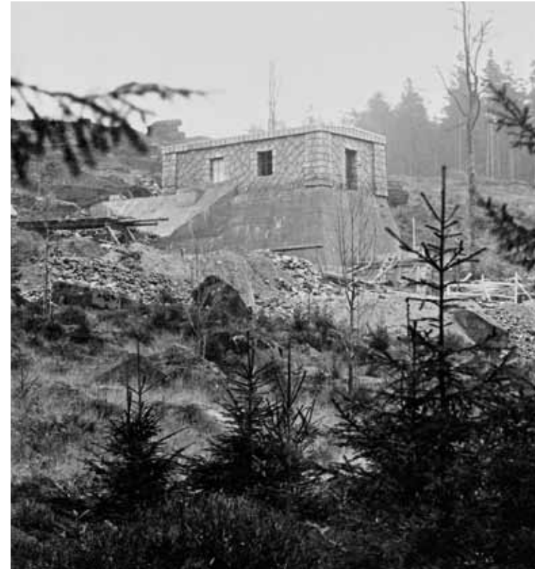
Vodní zámek před dokončením, 1926–27

v hlubokých špaletách a masivní, plochá korunní římsa nesoucí výrazně předsazenou valbovou střechu. Ta byla původně krytá pálenými taškami bobrovkami s volskými oky, dnes bitumenovým šindelem.