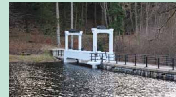
Hráz vyrovnávací nádrže s automatickým klapkovým uzávěrem

V roce 2019 vydal NPÚ, ÚOP v Liberci ve spolupráci s Libereckým krajem v rámci projektu Prezentace památek a ve spolupráci se státním podnikem Povodí Labe. ISBN 978-80-87810-37-8