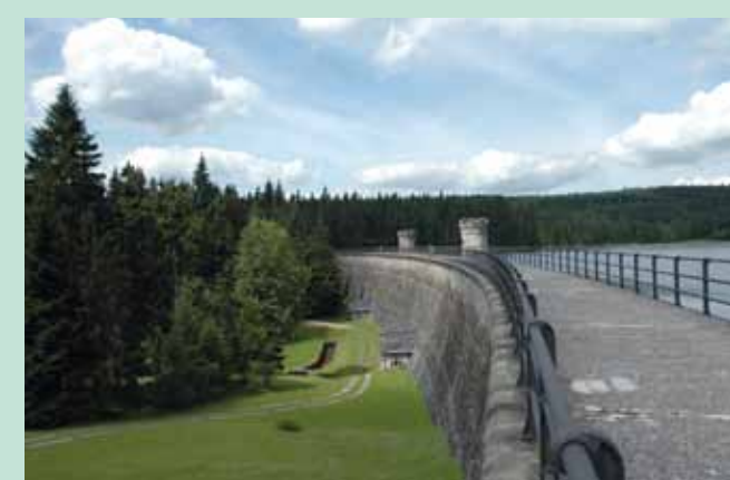
Hráz přehrady Bedřichov na Černé Nise