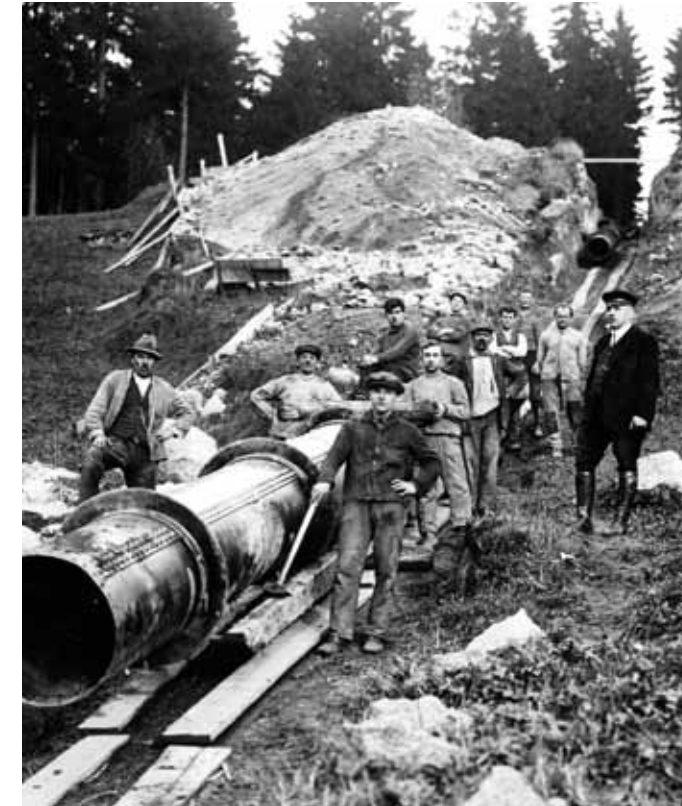
Pokládka tlakového potrubí, 1926