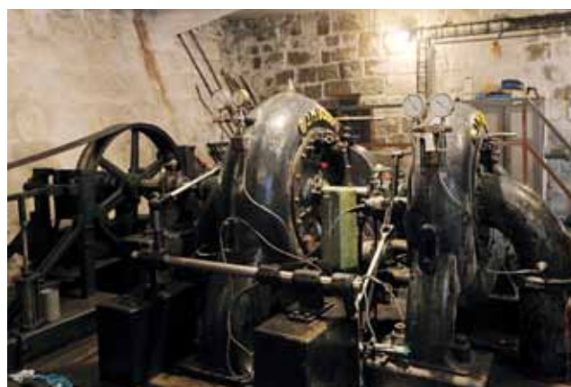
Strojovna MVE II s Francisovou turbínou

některých prvků elektrické části (rozvodna a blokový transformátor 5/10 kV, elektrická část poruchové automatiky). Také proběhly dílčí stavební úpravy, jako např. výměna střešní krytiny za hliníkové šablony. Roku 1996 přešla elektrárna do vlastnictví Povodí Labe a její provoz od té doby zajišťuje závod Jablonec nad Nisou, provozní středisko Liberec. V roce 2001 byla vybavena monitorovacím systémem pro automatické sledování meteorologických, hydrologických a provozních veličin MVE Bedřichov, Rudolfovo I a II. Mezi roky 2012–2013 prošlo