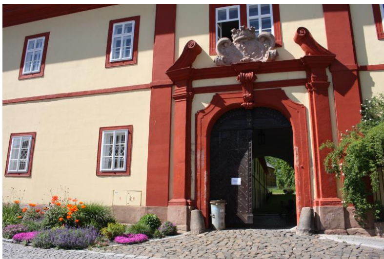
Nahoře: foto severního průčelí (4. 10. 2022), dole: jižní průčelí č. p. 1 (1. 6. 2020)