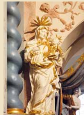
Socha sv. Anny z hlavního oltáře