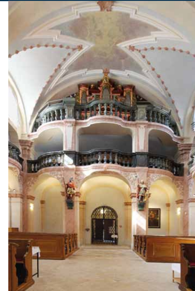
Západní strana kostela s varhanní kruchtou