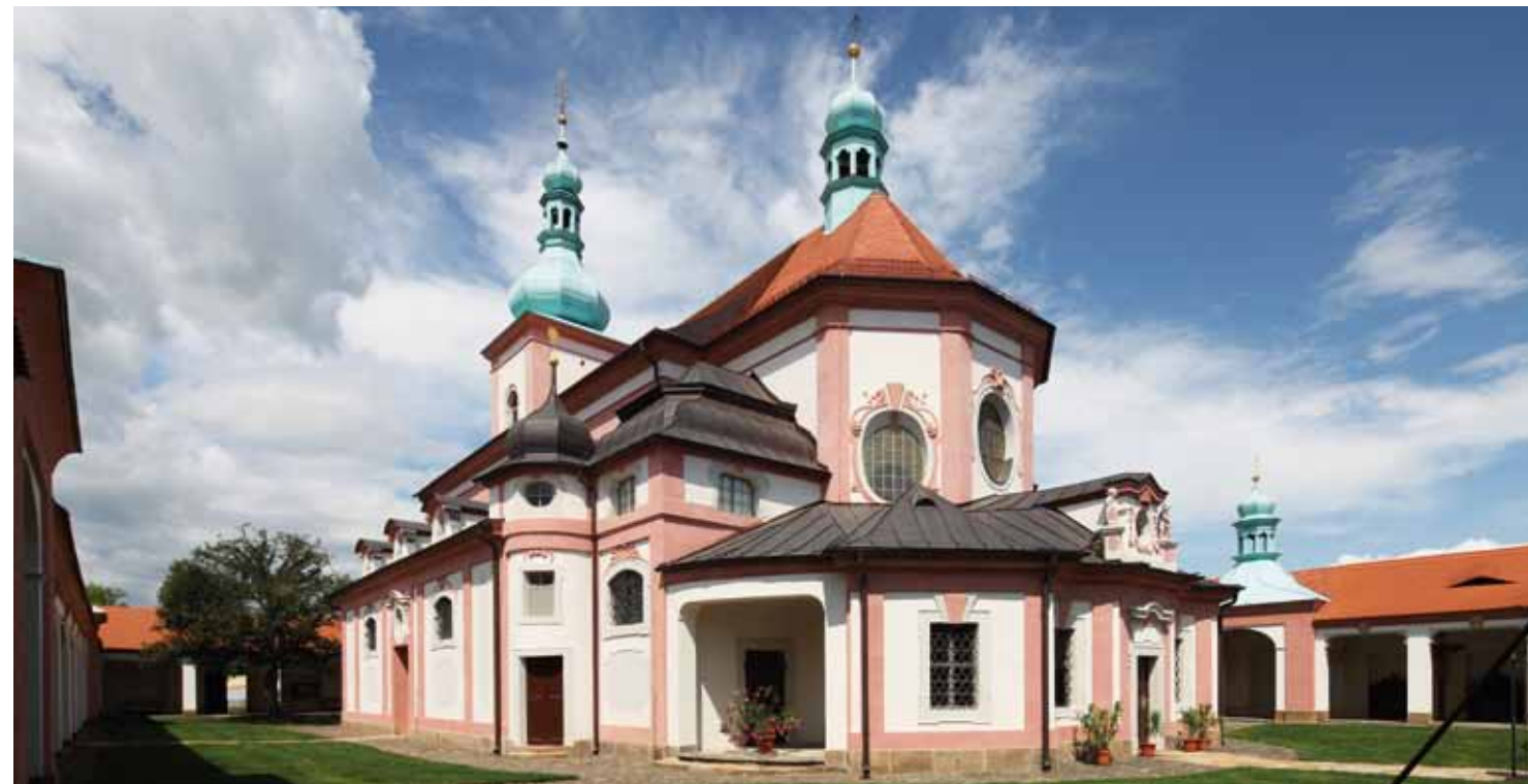
Pohled na kostel s ambity od jihovýchodu

Podle legendy byla roku 1523 na břehu řeky Ploučnice nalezena socha Panny Marie, jež byla přenesena do kostela. Na místě jejího nalezení stojí od roku 1744 pískovcový pilíř s mariánskou sochou, která má dva obličej. Jeden hledí na zámek a druhý směrem ke kostelu. Přenesením „zázračné“ sochy, o které se tradovalo, že vyslyší prosebné modlitby o pomoc či uzdravení, do kostela se Horní Police stala poutním místem. Poutě se postupně rozvíjely a počet poutníků rostl.