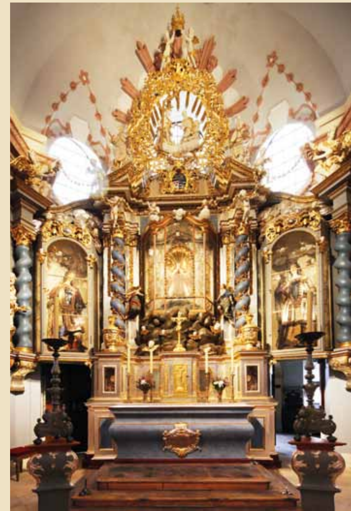
Hlavní oltář se sochou Panny Marie Hornopolické a ostatkovými figurami sv. Kristiny a sv. Pavla

Ve střední části oltáře za svatostánkem je umístěná skleněná skříň se sochou Panny Marie Hornopolické. Socha je ikonografickým typem Panny Marie v naději, tedy těhotné Panny Marie (Maria Gravidia). Na břicho má prosklenou schránku, v níž je umístěna drobná postavička klečícího a modlícího se Jezulátka. Panna Maria je podle liturgického období nebo slavnosti oblékána do šatů, které jí v průběhu staletí věnovali věřící.