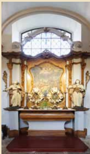
Boční oltáře sv. Barbory a sv. Tekly

V jižní boční lodi se nacházejí oltáře sv. Josefa, sv. Blažeje a sv. Aloise. V severní boční lodi jsou situované oltáře Božího hrobu, Klanění Tří králů, sv. Anny, sv. Barbory a sv. Tekly.