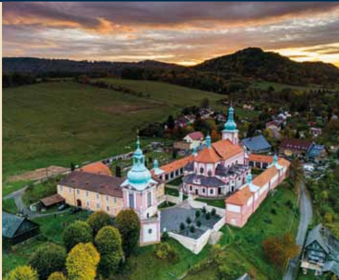
Celkový pohled na areál kostela Navštívení Panny Marie

Areál poutního místa je situován na vyvýšenině nad obcí Horní Police, která se rozkládá především na levém břehu řeky Ploučnice. Barokní areál zahrnuje kostel Navštívení Panny Marie, ambity s pěti věžičkami, které jej obklopují z jižní, západní a severní strany a volně stojící zvonici, která zároveň slouží jako vstup do areálu. K souboru budov patří ještě objekt arciděkanství. Areál je kulturní památkou registrovanou v Ústředním seznamu kulturních památek ČR pod rejstříkovým číslem 14207/5-2975 a od 1. července 2018 se stal národní kulturní památkou.