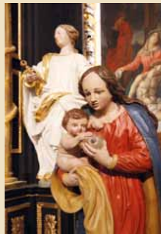
Socha Panny Marie Chlebové