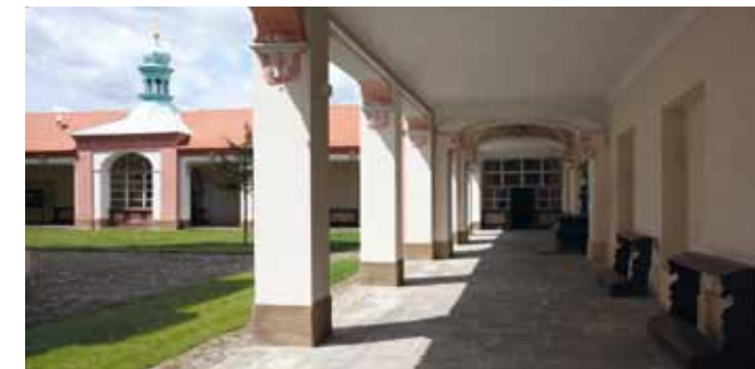
Severozápadní strana ambity

Od této doby byl kostel pouze udržován a probíhaly jen nejnnutnější opravy.