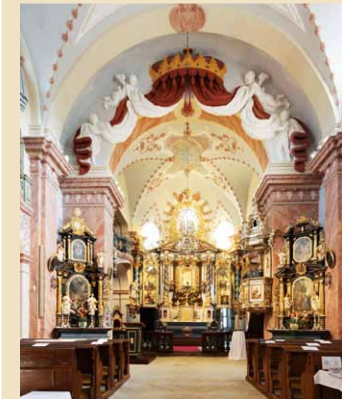
Pohled k presbytáři

Pozdně baroknímu interiéru dominuje triumfální oblouk, který vynáší mohutný baldachýn se čtyřmi anděly, korunou a dvěma závěsy. Ve štukových rámech na klenbě hlavní lodi a presbytáře se nacházejí nástropní malby s motivem andělů. V závěru presbytáře je osazen mohutný hlavní oltář. V presbytáři se dále nachází kazatelna a za ní modrý baldachýn s oválným reliéfem sv. Kristiny. Ze stropu hlavní lodi visí benátský lustr z 18. století. V hlavní lodi vedle triumfálního oblouku stojí dva boční oltáře – Panny Marie Bolestné a Navštívení Panny Marie. Další oltáře se nacházejí v bočních lodích. Na kůru jsou varhany z roku 1706 (v letech 2018–2019 obnovené do barokní podoby). Pod dvoupatrovou kruchtou na západní straně stojí na konzolách sochy sv. Floriána a sv. Václava.