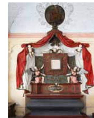
Kaple Panny Marie Sněžné