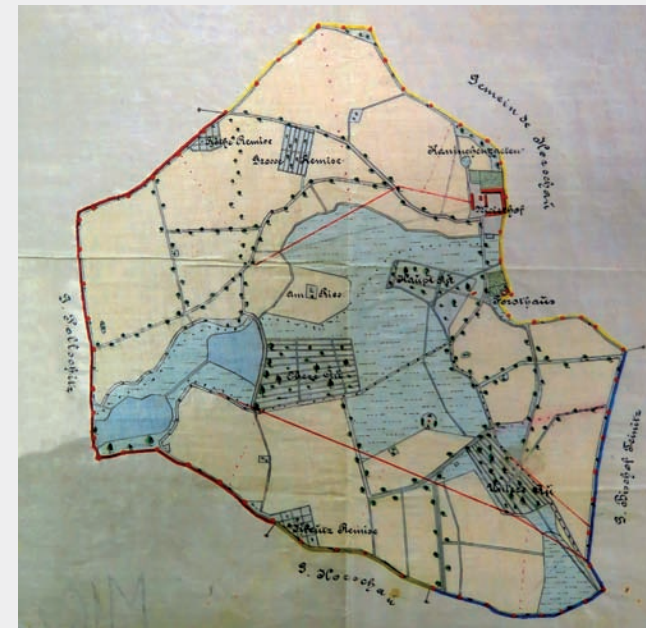
Horšovská obora – bažantnice. Plán z roku 1910.