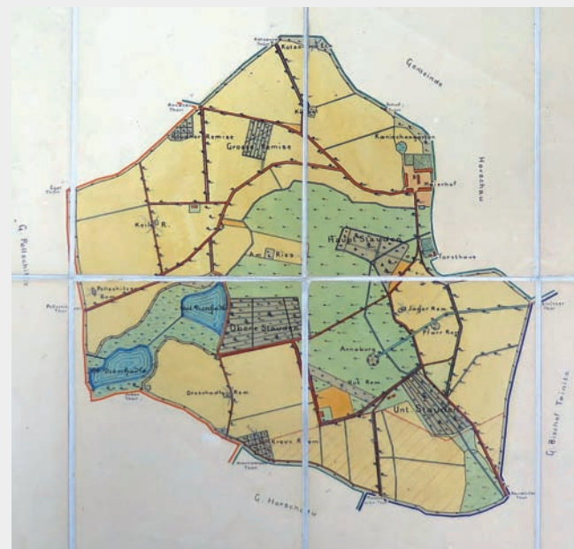
Horšovská obora – bažantnice. Autor plánu: Bittner, 1899.

Das Wildgehege Horšov befindet sich westlich von der Stadt und Schlossanlage Horšovský Týn auf dem von den Dörfern Polžice, Horšov und Nová Ves (z. Z. Bestandteil von Horšovský Týn) begrenzten Gebiet. Das Wildgehege gehört zu den ältesten Jagdanlagen in der westböhmisches Region und erstreckt sich auf der Fläche von 374 ha. Seit dem späten Mittelalter wurde das Herrngut Horšovský Týn allmählich von drei adeligen Geschlechtern gehalten. Nach den Hussitenkriegen gehörte es den Herren von Ronšperk, von 1539 bis zur Konfiszierung infolge der Schlacht am Weißen Berg 1620 der Familie Lobkowitz und zwischen 1622 und 1945 dem Geschlecht Trauttmansdorff. Angelegt wurde das Wildgehege wahrscheinlich von Vilém dem Älteren Popel von Lobkowitz (1567-1626) im Jahre 1593. Den ältesten ikonographischen Urkunden aus den Jahren 1764-1768 zufolge befand sich im Gehege ein System von mindestens vier Teichen, die mittels einer aus dem Fluss Radbuza geführten