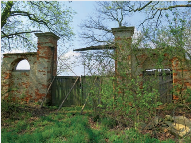
Horšovská obora, západní brána u Polžic.

Horšovská obora se řadí mezi nejstarší lovecká zařízení západočeského regionu. Rozkládá se na ploše 374 ha a k jejímu založení došlo pravděpodobně v roce 1593. Horšovskotýnské panství držely od pozdního středověku tři šlechtické rody. Po husitských válkách bylo majetkem pánů z Ronšperka, od roku 1539 do roku 1622 Lobkoviců, a v letech 1623 až 1945 Trauttmansdorffů. Oboru založil pravděpodobně Vilém starší Popel z Lobkovic (1567–1626) v močalovitém přírodním prostředí, příhodném pro chov populací bažantů, koroptví i křepelek. Podle historiků Augusta Sedláčka (1843–1926) a Františka Alexandra Hebera (1815–1849) posloužily k výstavbě kamenné zdi zbytky zaniklé horšovské tvrze nebo spíše biskupského dvorce, který stál v sousedství horšovského kostela Všech svatých. Přestože