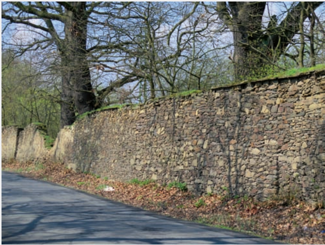
Horšovská obora, úsek kamenné zdi ohrazení u Nové Vsi. Dnes součást města Horšovský Týn.

Horšovská obora se nachází západně od města a zámku Horšovský Týn a vymezují ji obce Polžice, Horšov a Nová Ves (dnes součást města Horšovský Týn). Obora byla prohlášena roku 2009 společně s poplužním dvorem, loveckým pavilonem Annaburg a s venkovskou usedlostí čp. 2 kulturní památkou, která je evidována v Ústředním seznamu kulturních památek České republiky pod názvem Obora horšovská s poplužním dvorem a dalšími stavbami .