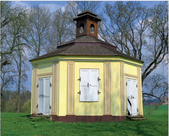
Horšovská obora, gloriét Annaburg.

V roce 1945 gloriét přestal sloužit svému účelu a jeho stav se po absenci údržby zhoršoval. Nejprve došlo ke zborcení střešní konstrukce se stropem, čímž se stavba ocitla v havarijním stavu. Zásluhou správy nedalekého horšovského statku ve spolupráci se Střední odbornou školou a Středním odborným učilištěm Horšovský Týn se podařilo roku 2009 Annaburg obnovit.