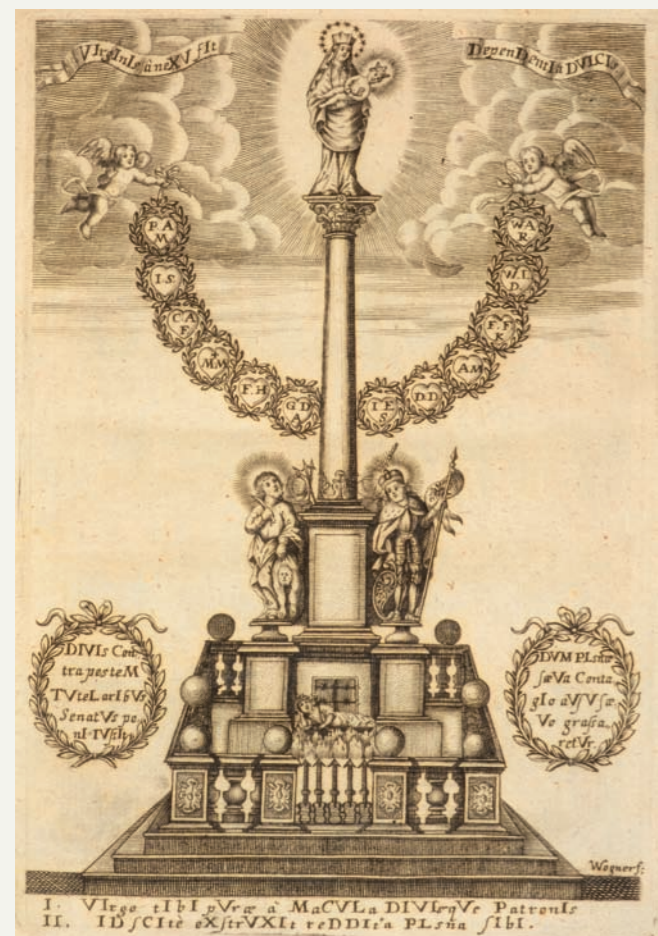
Vyobrazení mariánského sloupu v Plzni v roce dokončení jeho stavby 1681.

Okolnosti vzniku sloupu jsou poměrně dobře zachyceny ve zprávě pořízené nejspíš ještě v 18. století, ale zachované jen v opisu z 19. století. Uvádí se v ní, že stavba začala v roce 1680: „... Dne 22. září se tu na náměstí místo pouťe na Svatou horu [u Příbrami] konalo slavnostní procesí s Nejsvětější svátostí a při této příležitosti zdejší městská rada se souhlasem měšťanstva složila slavnostní slib, že k odvrácení Božího hněvu a zmírnění moru postaví sloup ke cti a chvále Nejsvětější