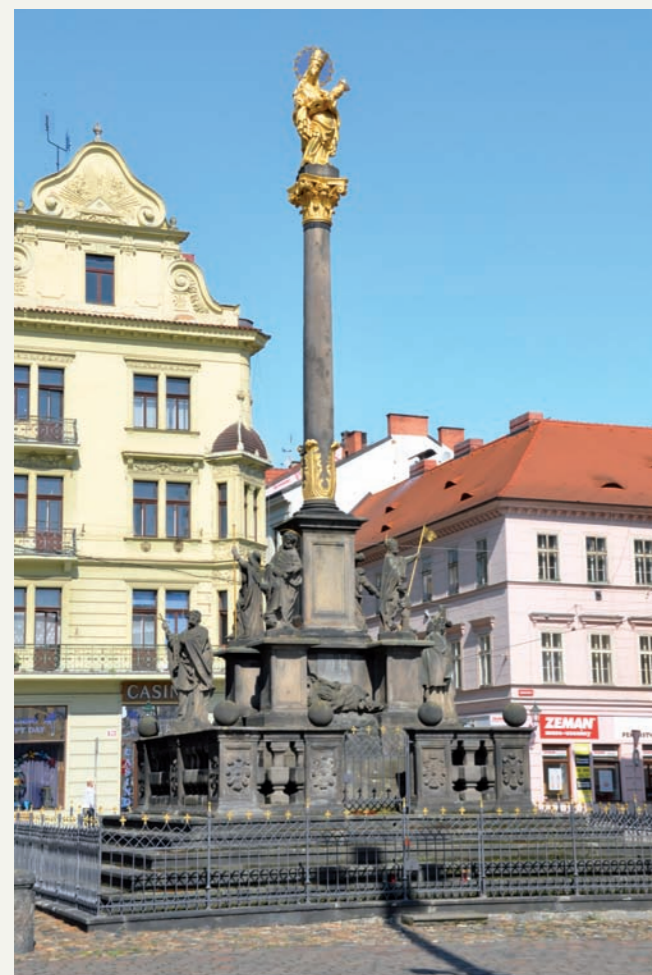
Celkový pohled na mariánský sloup v Plzni od jihovýchodu.

Důkladná oprava sloupu proběhla v roce 1931 nákladem necelých 20 000 Kč. Sochařskou práci vykonal J. Bezděk, zlatení bylo