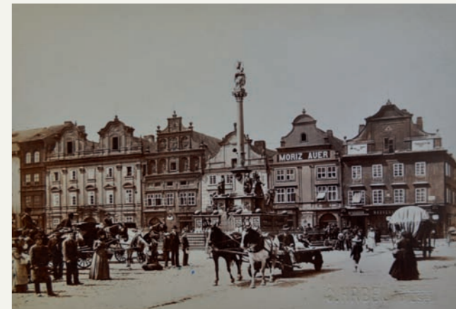
Mariánský sloup v Plzni na fotografii z doby před rokem 1890.

zentující řeholní společenství byli umístěni na boční strany. Jedná se o jezuitského misionáře sv. Františka Xaverského s křížkem v pravici a sv. Petra z Alkantary, v českém barokním sochařství poměrně málo zobrazovaného asketu a reformátora františkánského řádu; jeho socha na způsob stojícího bezvousého světece držící ob-