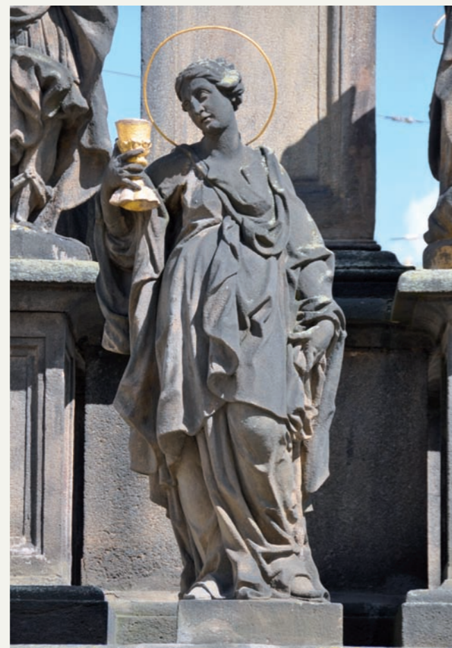
Plzeň, náměstí Republiky, mariánský sloup. Socha sv. Barbory.

Die Säule mit der Statue der Jungfrau Maria (Madonna) von Pilsen und mit anderen Statuen der Heiligen gehört zu einer Gruppe der manchmal bemerkenswerten barocken Skulpturen Pilsens. Wie viele andere Pestsäulen in den böhmischen Ländern ist die Marien-