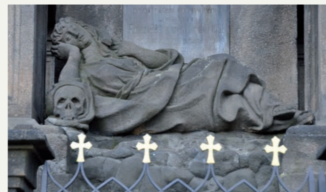
Plzeň, náměstí Republiky, mariánský sloup. Socha sv. Rozálie Palermské.