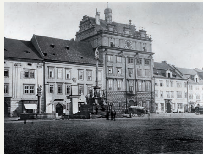
Severní část náměstí v Plzni s mariánským sloupem v prostoru mezi kostelem sv. Bartoloměje a radnicí. Foto z doby kolem roku 1865.

Podstavec sloupu je hranolový, na čtvercovém půdorysu, třietážový. V nárožích druhé etáže je obohacen čtyřmi zvlášť připojenými pilíři, které slouží jako podstavce pro čtveřici soch, osazených diagonálně vůči svislé ose sloupu a pocházejících z doby jeho vzniku. Tuto etapu sochařské výzdoby zhotovil Kristián Wiedemann. Tvoří ji socha patrona města, apoštola sv. Bartoloměje, obrácená směrem k městskému chrámu (světec je zobrazen se svými obvyklými atributy – s vlastní staženou kůží a s nožem v levici), socha