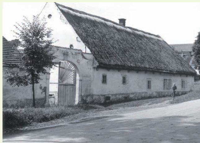
Pohled od severovýchodu na obytné stavení ještě se slaměnou (doškovou) střechou a na zadní bránu z roku 1830. (Stav v roce 1970)