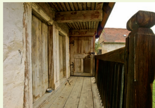
Pavlačka vzadu na nádvoří straně obytného stavení.

Obytná část je v předním dílu dvoutraktová (světnice a světnička). Střední díl se dále dispozičně člení na vstupní síň a někdejší, v minulosti ovšem již zmodernizovanou černou kuchyni včetně pece. Z kuchyně vede podél severní obvodové zdi domu chodbička do malé komory zřízené v zadním dílu, jenž zahrnuje další velkou (zadní) světnici s okny do dvora. Z této světnice lze vstoupit do zadní třetiny celého objektu, sloužící kdysi převážně hospodářským účelům a uspořádané, jak již bylo výše zmíněno, do dvou úrovní: nahoře jsou celkem čtyři komory a v přízemí malé chlévy sklenuté šesticí takzvaných placek do pasů na dva střední pilíře.