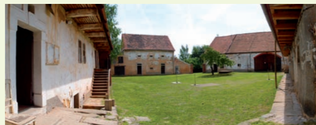
Pohled do dvora od hlavní brány. Zcela vlevo je kamenný vstupní portál do síně v obytném stavení (na nadpraží portálu je vyryt letopočet 1809).

Koncem sedmdesátých let 20. století se v katastru Bolevce začalo s výstavbou velkého panelového sídliště, které padla za oběť značná část staré vesnice. Díky svým jedinečným památkovým hodnotám zůstalo zachováno alespoň jádro kolem návsi, formované středověkým urbanismem. Již tehdy se uplatnily úvahy o využití dvora U Matoušů k jiným než zemědělským účelům (návrh na zřízení stanice mladých přírodovědců nebyl realizován). V devadesátých letech 20. století byl dvůr ve špatném technickém stavu navrácen původním majitelům. Myšlenka na jeho využití