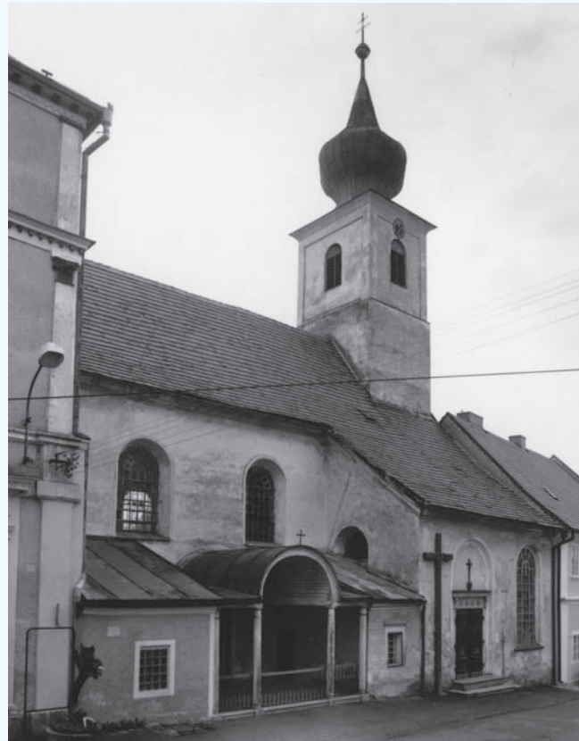
Pohled od severozápadu.

Ve druhé polovině 17. století vzniklo na Chodsku sloučením několika menších panství rozsáhlé koutsko-trhanovské dominium s více než šesti tisíci poddanými. Jeho tvůrcem byl Wolf Maximilián z Lamingenu a Albeureuthu, nechvalně známý jako Lomikar a přemožitel chodské selské vzpoury na čele s Janem Sladkým Kozinou roku 1695. V roce 1697, tedy velmi krátce po Lamingenově smrti, bylo dominium prodáno. Novým majitelem se stal Jiří Jindřich Stadion (1640–1716). Ten roku 1711 přenechal zámek v Trhanově a ostatní majetek na Chodsku svému bratrovi Janu Filipovi. Stadionům Trhanov patřil až do vyměření jejich rodu v mužské linii v roce 1908.