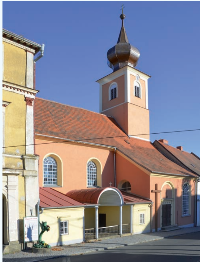
Pohled od severozápadu. (Foto autor, 2015)

Kostel prochází v posledních několika letech po etapách památkovou obnovou. Už jsou opraveny všechny střechy a fasády včetně věže. Pozornost budí nová barevnost. Převládá v ní výrazná cihlová červeně na velkých plochách hladkých omítek, zatímco články architektury jsou žlutobéžové; to se kupodivu netýká ap-