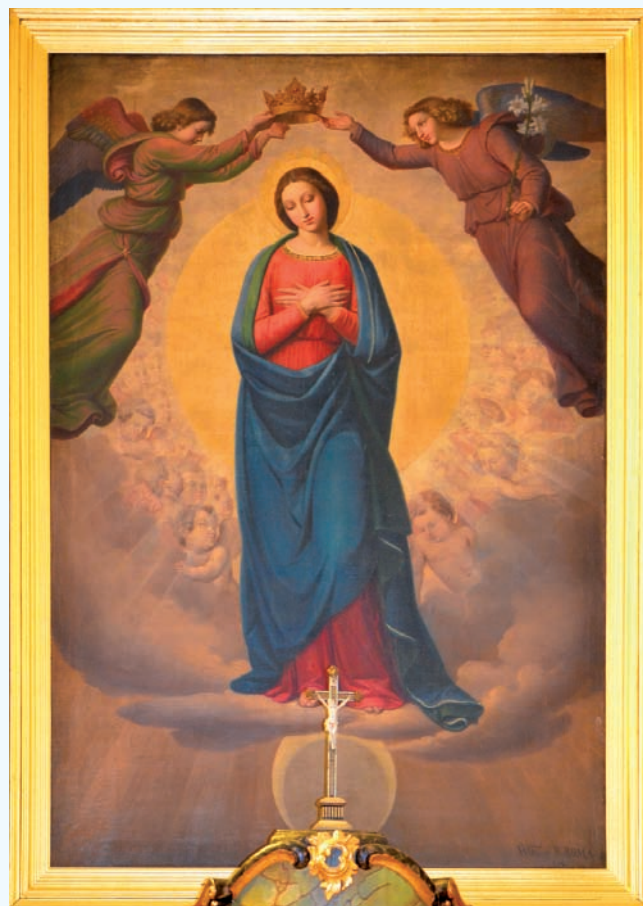
Hlavní oltář – obraz Panny Marie Immaculaty.