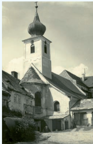
Pohled od jihovýchodu.

Apsida je sklenuta konchou s trojbokými výsečemi a společně s chórem pohledově splývá v jeden oltářní prostor. To je dáno tím, že chór a apside mají přibližně stejnou šířku i výšku a že půlkruhový oblouk mezi nimi obdobně jako přípory, z nichž tento oblouk vybíhá, není příliš masivní. Po stranách jižní části lodi se nacházejí dvě plochostropé boční kaple s vlastním oltářem, navozující představu příčné lodi. Sousední, křížovou klenbou sklenuté místnosti po stranách chóru slouží jako sakristie a provozní zázemí. Všechny tyto boční prostory jsou vytvořeny souměrně podle podélné osy chrámové stavby. Různost jejich účelu není ve vnější skladbě stavebních hmot vyjádřena; jednotný průběh a výška obvodového zdiva, jakož i společná pultová střeška, plynuce navazující na sedlovou střechu kostela, to vše je projevem původního architektonického záměru.