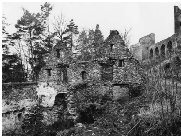
Obr. 2. Velhartice, hrad. Bývalý hradní pivovar. Pohled na hlavní průčelí s typickým podvojným štítem sedlových střech.