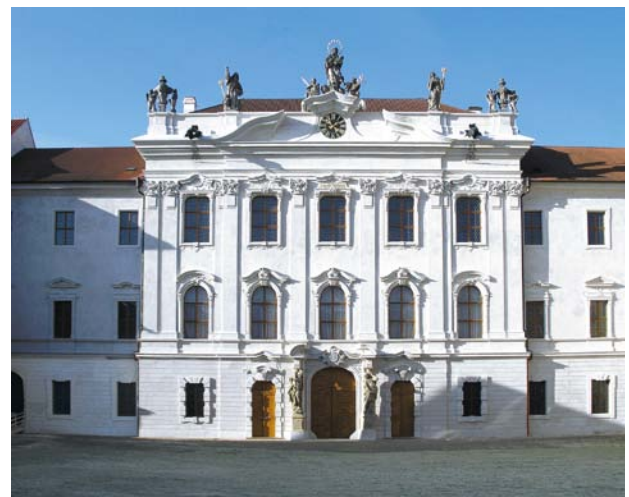
Kladruby (okr. Tachov), bývalý klášter. Východní hlavní průčelí Nového konventu po památkové obnově.

Akce, kterou financovalo Ministerstvo kultury v rámci Integrovaného systému programového financování (ISPROFIN/SMVS), patřila mezi vůbec největší