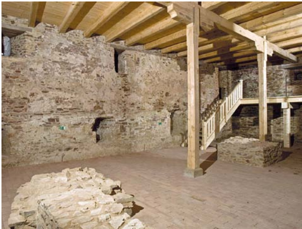
Obr. 3. Velhartice, hrad. Bývalý hradní pivovar. Pohled do interiéru v přízemí západního traktu (kdysi sladovnické humno) po památkové obnově.

prostředky z Programu záchrany architektonického dědictví Ministerstva kultury. V závislosti na tom se mohlo začít s intenzivnější a systematickou obnovou, zčásti rekonstrukcí, již provázel podle potřeby záchranný archeologický výzkum. Byly podniknuty i další dílčí průzkumové a dokumentační práce, jejichž výsledky ve svém souhrnu podstatnou měrou přispěly mimo jiné k pravdivějšímu poznání stavebních dějin hradního areálu.