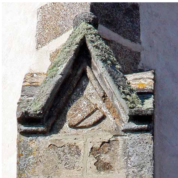
Obr. 2. Nezamyslice, kostel Nanebevzetí Panny Marie. Závěr presbyteria. Detail znakového štítu s figurou kůlu na jihovýchodním opěráku.