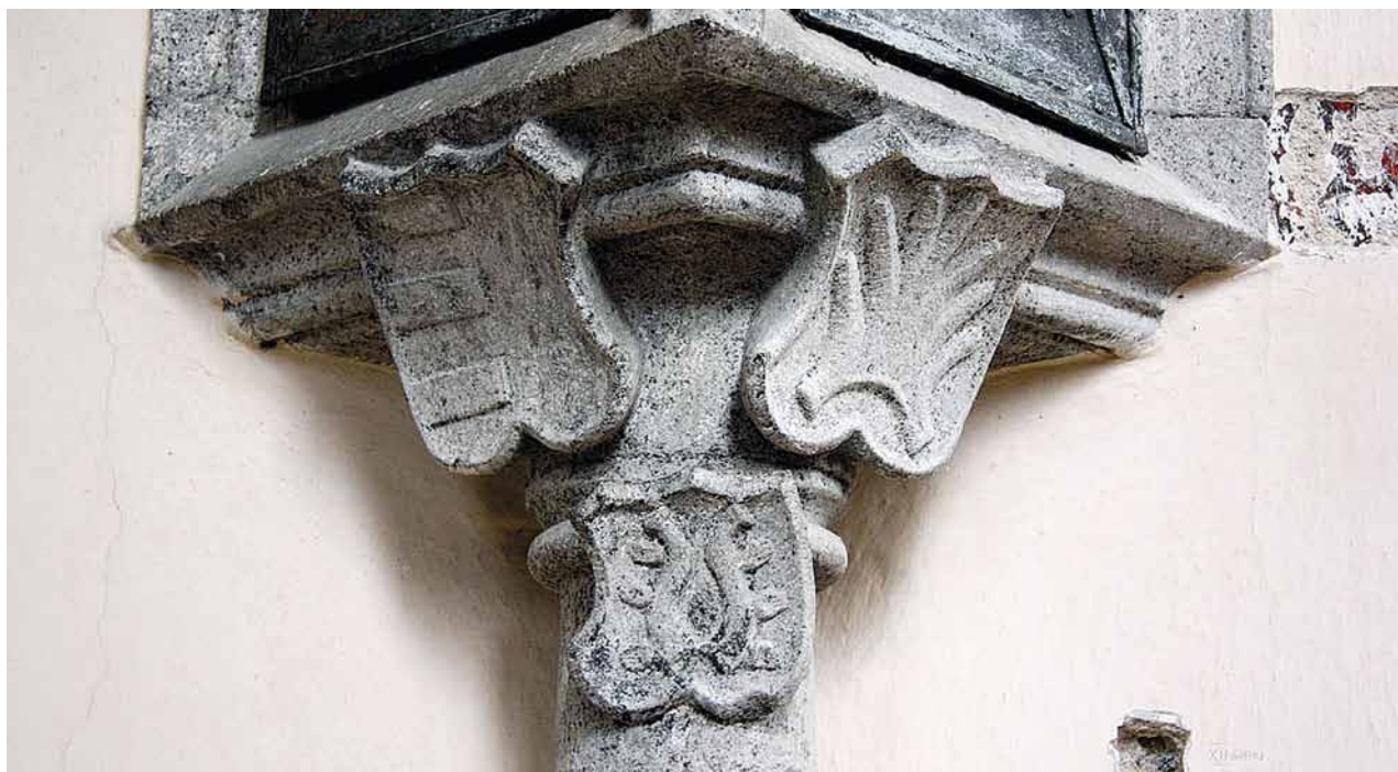
Obr. 4. Nezamyslice, kostel Nanebevzetí Panny Marie. Sanktuář v presbyteriu. Heraldická výzdoba s erby Půty Švihovského z Rýzemberka, Bohunky Meziříčské z Lomnice a Zachaře z Opatovic.

Kněz Jan vystupuje v historických pramenech jako rektor kostela, nikoli probošt v Nezamyslicích. Pokud se jím v následujícím období nestal, pak přinejmenším na přelomu let 1395 a 1396 byla tato funkce obsazena nejspíš někým jiným. Tím se dostáváme k pokusu o identifikaci druhého znaku. Ten by mohl náležet právě nezamyslickému proboštvu. Jeho jméno se nepodařilo dohledat. Štítek se znamením kůlu se však uplatňuje na pečetích opata Žibřida ( Zyffrida , Siffrida , Siegfrieda ), jenž stál v čele