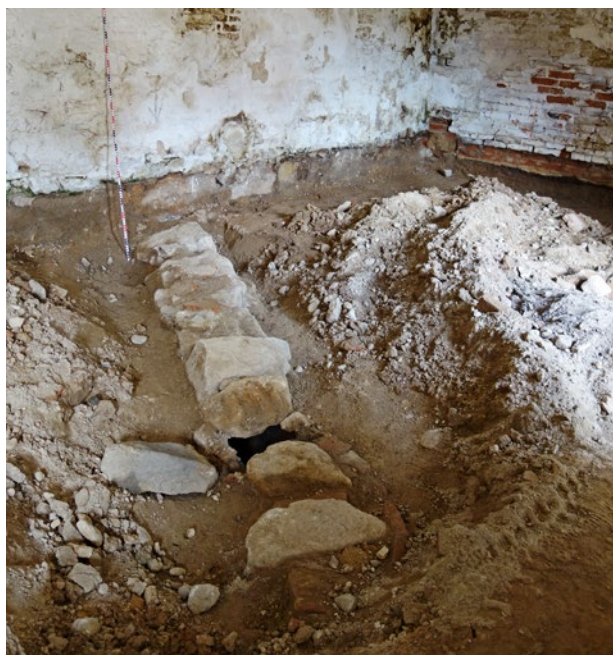
Obr. 9. Plzeň-Bolevec, selský statek U Matoušů čp. 1. Nález kamenného zděného kanálu ve velké stáji.

Ačkoliv terénní výkopy probíhaly v areálu selského dvora v poměrně velké míře, archeologická zjištění jsou skromná a představují pouze několik omezených dokladů