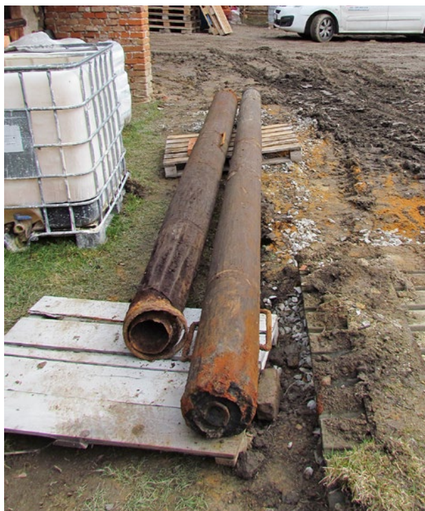
Obr. 4. Plzeň-Bolevec, selský statek U Matoušů čp. 1. Dřevěné potrubí nalezené ve studni, které je nyní po konzervaci součástí expozice.