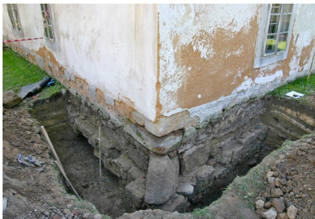
Obr. 1. Plzeň-Bolevec, selský statek U Matoušů čp. 1. Výkop u severovýchodního nároží obytného stavení ozřejmil původní úroveň terénu a odhalil odrazník v nároží.