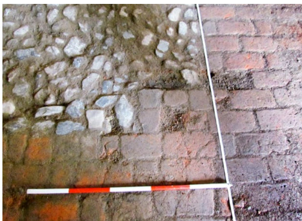
Obr. 8. Plzeň-Bolevec, selský statek U Matoušů čp. 1. Starší valounová dlažba v interiéru stáje byla později nahrazena dlažbou cihlovou.

Další interiérové nálezy byly učiněny ve stáji. V jižní místnosti objektu se podařilo objevit prvotní kamennou dlažbu, která se původně nacházela zřejmě v rozsahu celé místnosti a později byla nahrazena cihlovou dlažbou, s výjimkou dokumentované partie valounové dlažby (obr. 8). Velkou stáj odvodňoval kamenný zděný kanál překrytý rozměrnými kameny, odhalený ve střední části objektu (obr. 9). Vnitřek o výšce 33 cm z poloviny zaplňuje bahnitý sediment. Kanál směřoval od západní stěny mírně šikmo k východní stěně. Další průběh kanálku či návaznost na kanalizaci objevenou ve dvoře se nepodařilo ověřit.