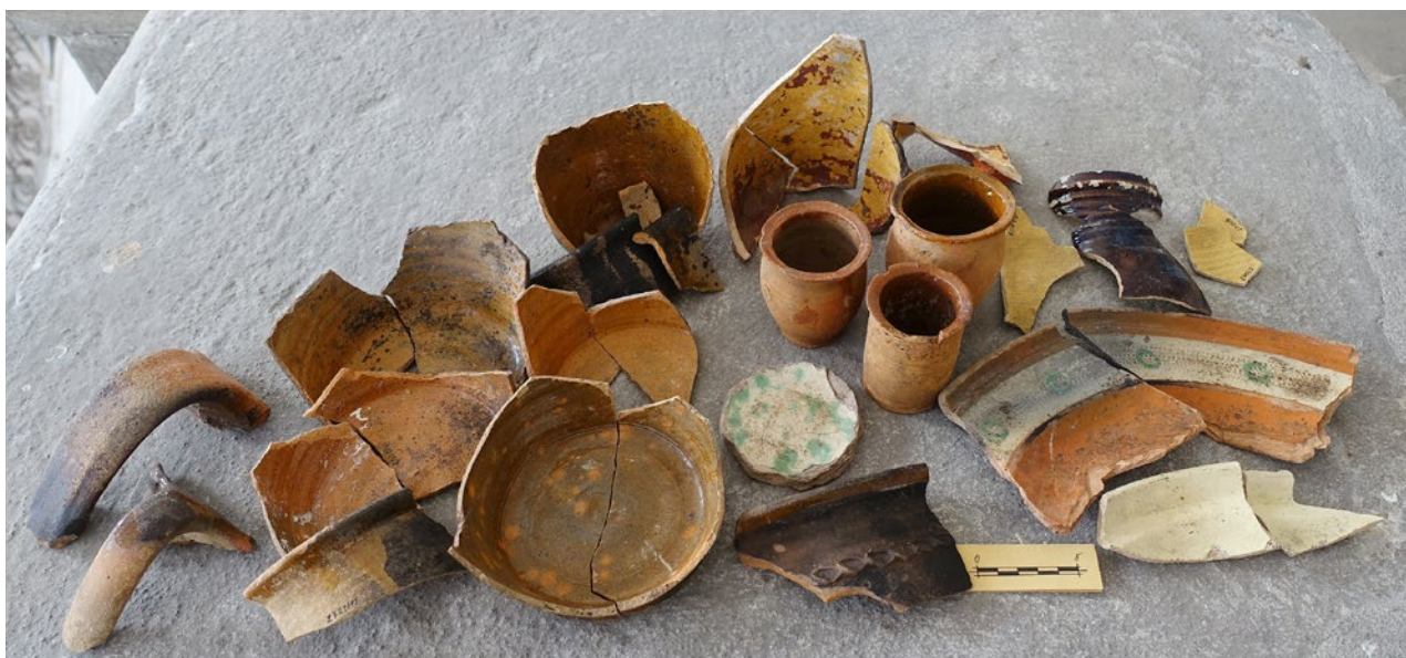
Obr. 7. Plzeň-Bolevec, selský statek U Matoušů čp. 1. V interiéru hospodářské části domu byly nalezeny fragmenty keramiky z 18. století včetně lékárenských nádobek.

blízkosti středního okna, zatímco v minulosti přiléhala dělicí příčka přesně v polovině mezi okny. V jihovýchodním rohu světnice se cihlová dlažba dochovala na čtvercové ploše o straně cca 1,5 m. V rámci interpretace lze tuto podlahovou krytinu považovat jako dodatečnou úpravu související pravděpodobně s umývacím koutem. O jiném členění vnitřku domu svědčí nález kamenných základů východní zdi o šířce cca 0,8 m v severovýchodním rohu pozdější kuchyně (viz obr. 5, obr. 6). Ze zásypu, vytěženého při opravě kleneb komor hospodářské části domu, se podařilo získat pozoruhodný soubor keramiky z 18. století. Kromě zlomků hrnců, džbánů, talíře a hluboké misky se dochovaly tři kompletní menší pohárky – lékárenské nádoby na masti (obr. 7).