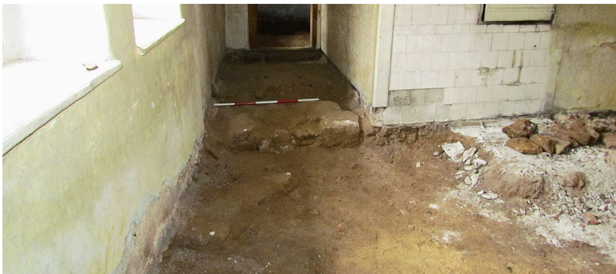
Obr. 6. Plzeň-Bolevec, selský statek U Matoušů čp. 1. Nález kamenných základů východní zdi v severovýchodním rohu pozdější kuchyně.

k prostřednímu vstupu do chlévů ve směru k západu, severu a jihu. Nacházely se 70 cm pod úroveň terénu a byly vyzděné z pískovce a kryté pískovcovými bloky. Přes malou vnitřní výšku (30 cm) a šířku (cca 24 cm) jsou kanály doposud čisté, jen s minimálním bahnitým sedimentem na dně z oblázků. V prostoru dvora byl dále proveden průzkum již nepoužívané studně, ve které se podařilo objevit dřevěné potrubí (obr. 4). Jeho těleso bylo konzervováno a je součástí expozice.