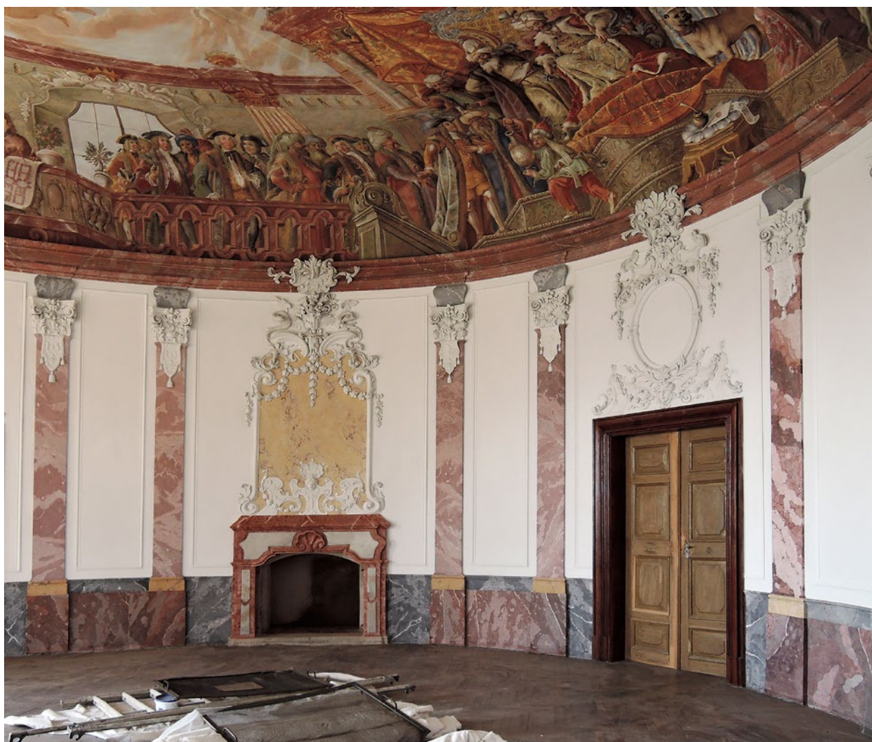
Obr. 6. Trpísty (okr. Tachov), zámek, tzv. Velký sál po obnově.

Mgr. L. Drncové a Ing. arch. L. Růžičkové, na Klatovské tř. představil historii a probíhající obnovu rezidence rodiny Semlerových zástupce Západočeské galerie v Plzni Ing. arch. Petr Domanický a Mgr. L. Drncová.