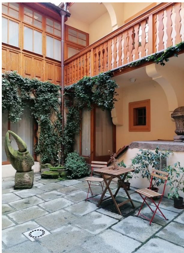
Obr. 5. Plzeň, Prešovská ul. 7, dům U Zlatého slunce – sídlo pracoviště NPÚ v Plzni. Dvůr je každoročně zpřístupněn veřejnosti v rámci akce Plzeňské dvorky.

a římsy. Výklad byl doplněn prezentací vedut, historických fotografií a dokumentace obnovovacích prací v průběhu 20. století. Následně vysvětlil důvod někdejší celoplošné barevné úpravy kamenných prvků průčelí a zvolenou barevnost fasád při stávající obnově. Po krátké přestávce představil obnovu mariánského sloupu ve Stříbře, která byla provedena v letech 2012–2015. Poté se účastníci přesunuli za prohlídkou této památky do Stříbra. Na závěr se mimo plánovaný program uskutečnila krátká návštěva části expozic zdejšího městského muzea.