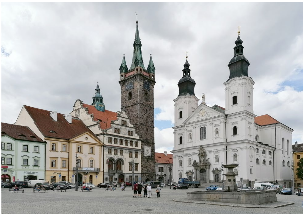
Obr. 3. Klatovy, náměstí Míru, pohled na radnici s Černou věží a jezuitský kostel Neposkvrněného početí Panny Marie a sv. Ignáce.