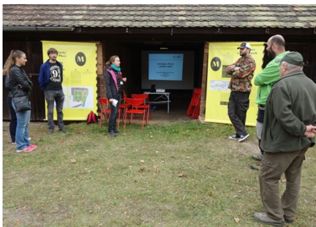
Obr. 4. Plasy (okr. Plzeň-sever), areál kláštera. Mezinárodní den archeologie 2018.

Jejím cílem je představovat známá i neznámá historická zákoutí města, která jsou běžně veřejnosti nepřístupná. Do akce je v rámci Plzně zapojeno na tři desítky objektů. 3 Nabývá na stále větší oblibě a účastní se jí několik set lidí, buď samostatně, nebo v rámci organizovaných prohlídek s průvodcem.