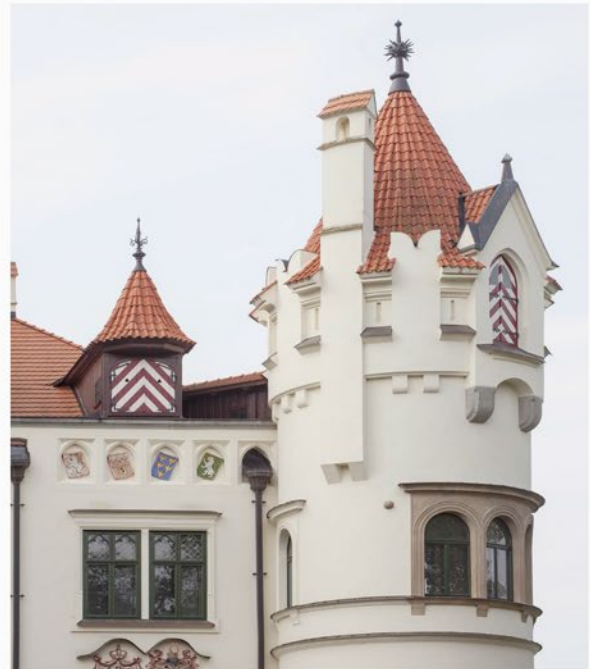
Obr. 9. Jeden z posterů z fotografického cyklu k obnově památek, prezentovaného ve výkladci na průčelí domu U Zlatého slunce, sídla pracoviště NPÚ v Plzni. (Zpracoval R. Kodera, 2021)