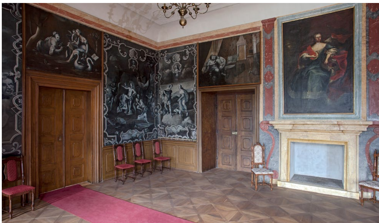
Obr. 2. Svojšín (okr. Tachov), zámek, slavnostní sál po obnově. (Foto J. Pohořalá, 2019)