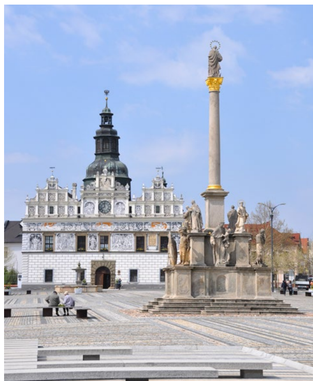
Obr. 1. Stříbro (okr. Tachov), Masarykovo náměstí s obnoveným mariánským sloupem a radnicí. (Foto V. Kovařík, 2019)

„Objev, nález roku“, za nález a restaurování renesanční nástropní malby, objevené během obnovy domu. Nález je veřejnosti přístupný v rámci obchodního prostoru.