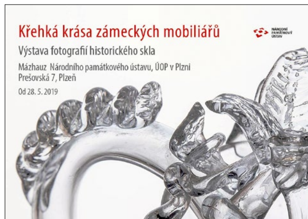
Obr. 8. Plakát výstavy Křehká krása zámeckých mobiliářů.