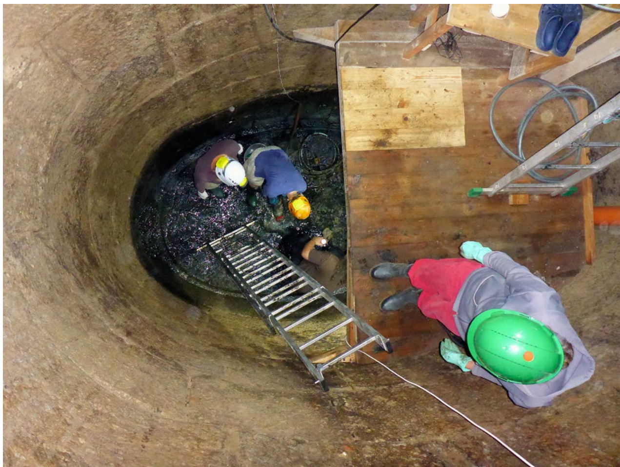
Obr. 10. Plasy, areál kláštera. Výzkum odpadní jímky v prelatuře.