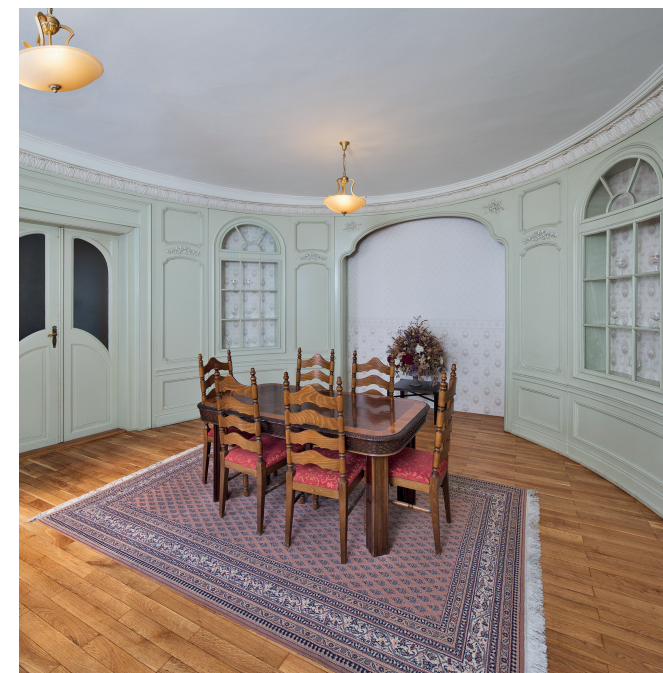
Salonek v sídle NPÚ, ÚOP v Praze.