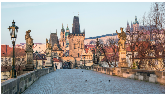
Malebnost a krásu Prahy vytváří dokonalé prolnutí budov, architektonických slohů, uměleckých děl a terénního reliéfu, umocněného hladinou Vltavy.

Na malebnosti Prahy se zásadní měrou podílí členitý terén a řeka Vltava s řadou ostrovů. V návaznosti na brod přes řeku se začala rozvíjet nejstarší zástavba historického města. V průběhu staletí se Praha stala sídlem českých panovníků a následně i hlavním městem českých zemí. Od 19. století se potom systematicky rozrůstala připojováním sousedních obcí. Tisícelý vývoj a stoupající význam města vyústil v jeho dnešní jedinečnou podobu, v níž se snoubí historie i současnost v pozoruhodné jednotě.