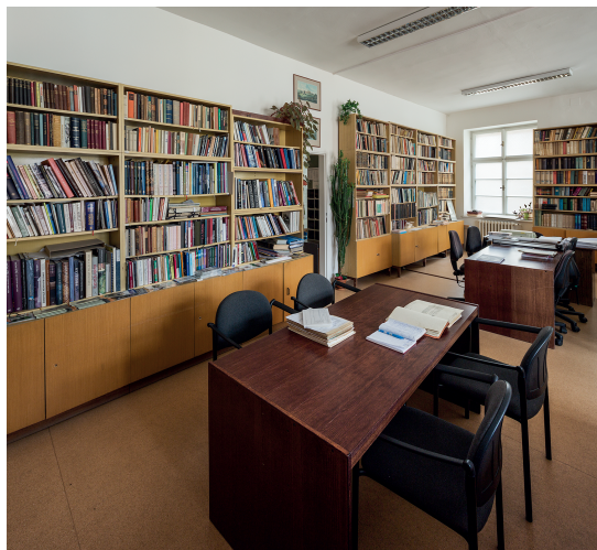
Knihovna s fondem pragensií a badatelna s bohatými dokumentačními fondy jsou pro veřejnost přístupné vždy v pondělí a ve středu od 8.30 do 12 hodin.