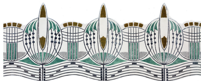
Detail výzdoby interiéru sídla pracoviště.