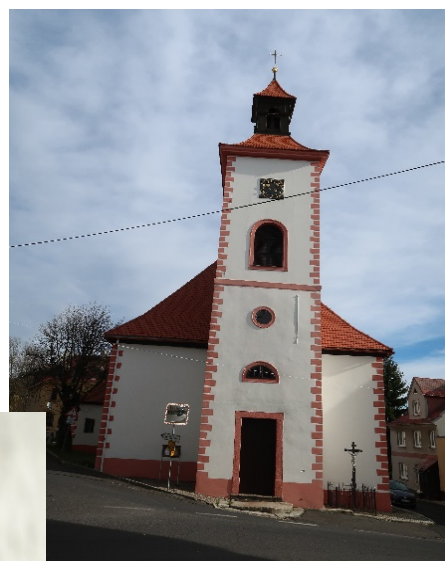
kostel Čtrnácti sv. pomocníků