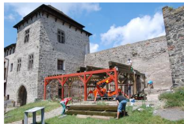
Kunětická hora – v procesu obnovy podle původní podoby Dušana Jurkoviče