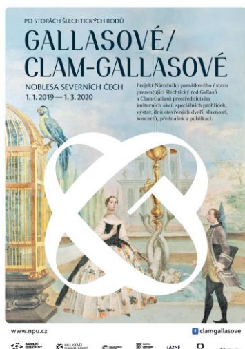
Plakát k roku CG

Záštitu projektu udělil ministr kultury, patronát nad rokem převzal Nadační fond - Clam-Gallas – Stiftungsfonds. (Nadační fond založený v roce 2015 potomky Clam-Gallasů.) Projektu se věnujeme i níže.