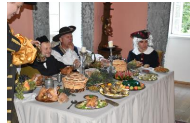
Hostina v rámci Hradozámeckého dne na Lemberku