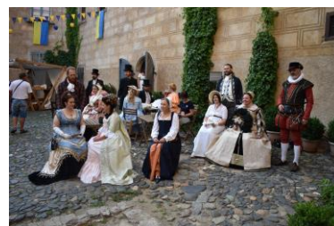
Hradozámecká noc na Grabštejně