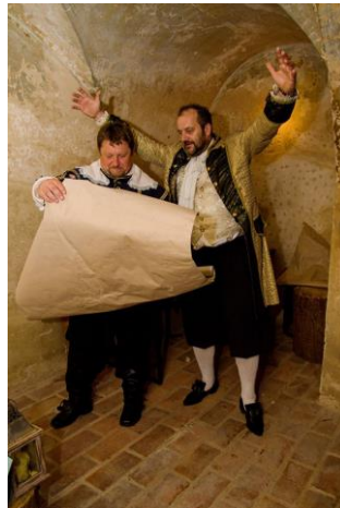
Noční prohlídky Ze života diplomata Jana Václava z Gallasu na Grabštejně