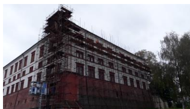
Obnova barokního krovu, stropů a střechy zámku Zákupy

V roce 2019 byla zahájena realizace celkové generální opravy objektu č.p. 10 v Ratibořicích za finanční podpory ze strany MK ČR. Původní využití bylo a po dokončení rekonstrukce opět bude jako objekt k bydlení. Správa zámku tento objekt nabídne svým zaměstnancům k dlouhodobému pronájmu a to v podobě čtyř nově zrekonstruovaných bytů s možností využití půdního prostoru jako skladu. Zároveň bude v prostoru objektu zrekonstruován inspekční pokoj pro příležitostné pracovní návštěvy. Komplexní obnova se týká celého objektu a jejím předmětem byla výměna krovu, střešního pláště, oprava narušených stropních konstrukcí pod půdou, obnova všech povrchů a to jak vnějších, tak i vnitřních. Kompletní výmalby všech prostor, obnova celkové infrastruktury (vnitřní rozvody vody, elektřiny i odpadů). Obnovou také prošly všechny výplně otvorů (okna a dveře). S rekonstrukcí objektu je také spojena nová instalace topné soustavy, jež byla umístěna ve sklepě objektu. čp.10 bude předána k užívání nejpozději do poloviny roku 2020.