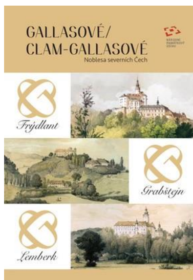
Publikace Gallasové/Clam-Gallasové. Noblesa severních Čech