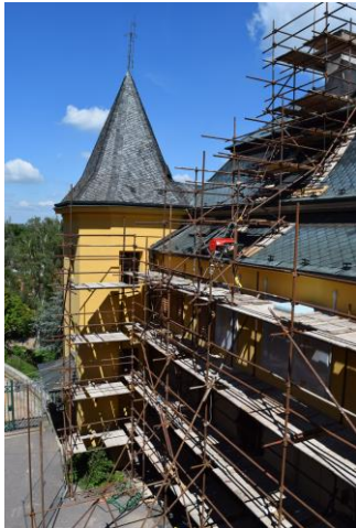
Obnova areálu zámku Slatiňany