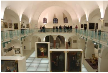
Výstava Spravedlnost bez bázně. Gallasové a Clam-Gallasové v Čechách v Oblastní galerii Liberec

přednášek vztahujících se k tomuto projektu, kdy přednášejícími byli pracovníci ÚPS a také kasteláni zapojených objektů.