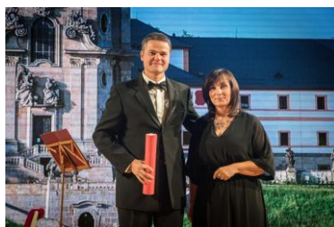
Barokní areál Kuks získal cenu Historice Opera