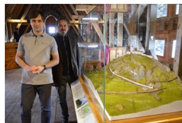
Model hradu Bezděz v podobě ze 13. století