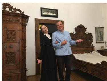
Noční prohlídky na zámku Náchod