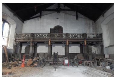
Hrádek u Nechanic nabídl prohlídky běžně nepřístupných prostor