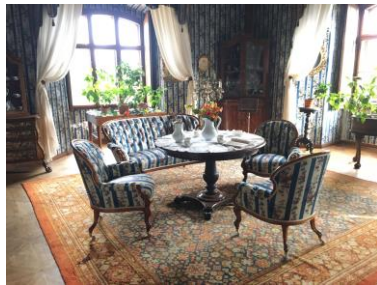
Zrestaurovaný soubor sedacího nábytku ze zámku Frýdlant