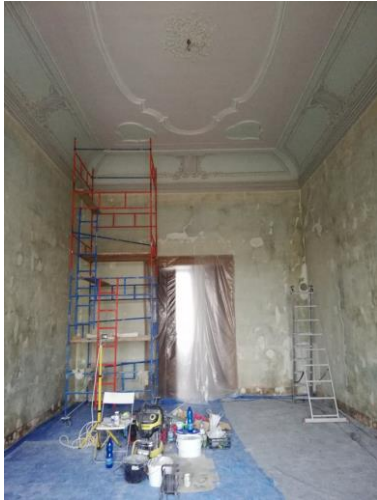
Příprava interiéru zámku Zákupy na novou expozici

původní látky a soubor sedacího nábytku jí byl v roce 2019 ocalouněn - část takto zrestaurovaného souboru sedacího nábytku byla i prezentována na výstavě věnované Gallasům a Clam-Gallasům v Oblastní galerii Liberec.