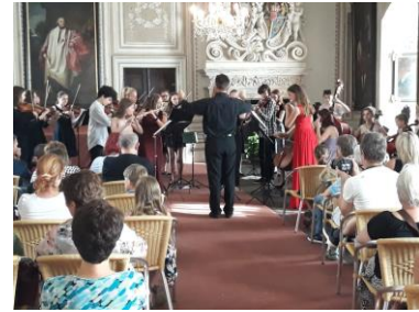
Hudba doby Gallasů a Clam-Gallasů na Frýdlantě