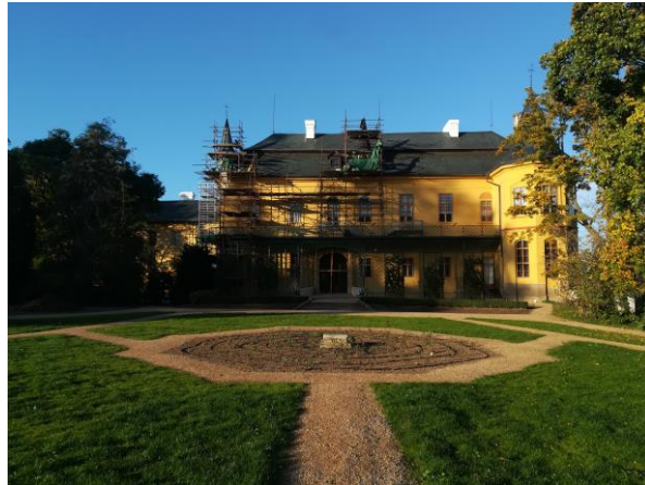
Obnova areálu zámku Slatiňany