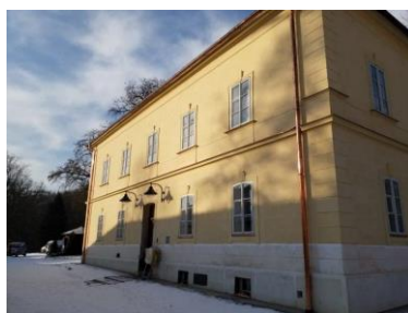
Generální oprava domu čp. 10 v Ratibořicích