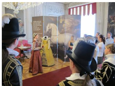
Litomyšl oslavila 20 let od zápisu na seznam světového dědictví UNESCO

Hrad slavil výročí 20 let od rekonstrukce a otevření Velké věže. K tomuto výročí byla připravena fotografická výstava zachycující proměnu, respektive citlivou rekonstrukci, vnitřních zchátralých prostor. V Templářském paláci byla doplněna expozice o archeologické nálezy z kleneb paláce a také zde byl umístěn model hradu, který zachycuje podobu Bezdězu z konce 13. století. Do kaple byla instalována nová skla do vitráží na jižní straně, byl opraven venkovní plášť i s operáky a v létě tak byla zpřístupněna vyhlídka pod kaplí.