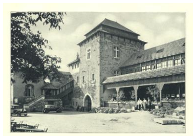
Kunětická hora – historická fotografie

V roce 2019 se naplno rozběhly stavební práce související s projektem IROP ITI „Kunětická hora Dušana Jurkoviče – básníka dřeva“. Projekt, financovaný z větší části z prostředků Evropské unie, se zaměřuje na obnovu dlouho nepřístupného západního křídla areálu, jehož podobu určil ve 20. letech minulého století architekt Dušan Jurkovič. Dřevěná vestavba (s novým návštěvnickým zázemím, tj. pokladnou a občerstvením pro návštěvníky) v severní části nádvoří bude veřejnosti zpřístupněna začátkem hlavní sezony 2020, zbývající část, tedy objekt šesté brány a přístavku s novými expozicemi (nový prohlídkový okruh) se otevře na jaře 2021. V zimním období byla dokončena rekonstrukce toalet na jižním nádvoří a byla navýšena jejich kapacita.