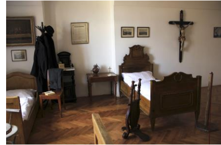
Nově instalovaná ložnice chovanců hospitálu Kuks