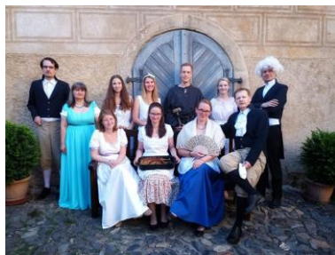
Kostýmované prohlídky na hradě Grabštejn