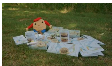
Soubor suvenýrů k CG roku