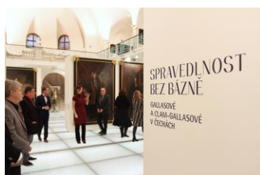
Výstava Spravedlnost bez bázně. Gallasové a Clam-Gallasové v Čechách