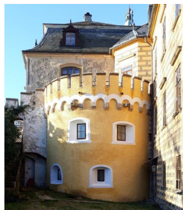
Zjištění konstrukce horní severovýchodní terasy na Frýdlantě