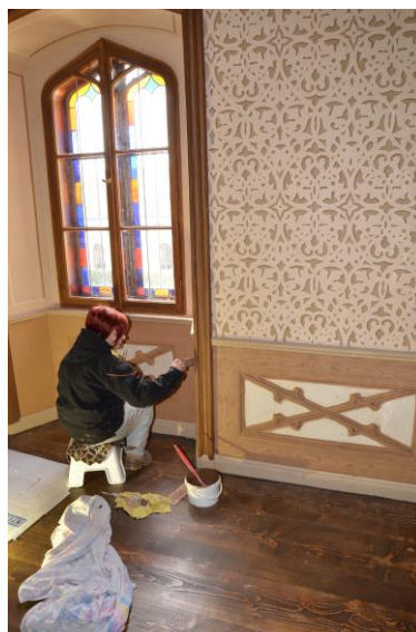
Příprava nové prohlídkové trasy na zámku Sychrov