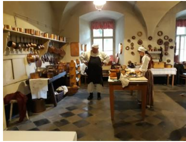
Akce Jak se vařilo a peklo u Clam-Gallasů na Frýdlantě