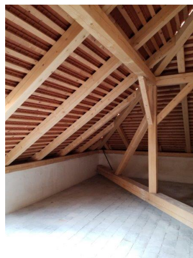
Generální oprava domu čp. 10 v Ratibořicích