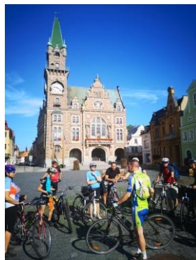
Cykloprohlídky po clam-gallasovských panstvích