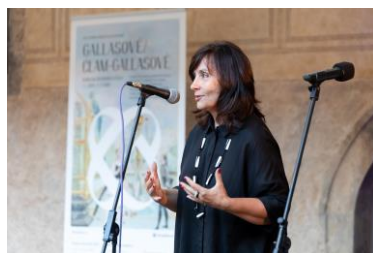
Generální ředitelka NPÚ na zahájení Hradozámecké noci