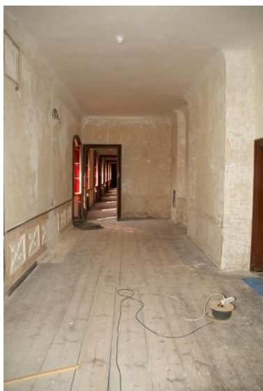
Příprava nové prohlídkové trasy na zámku Sychrov

Z hlediska větších stavebních obnov proběhlo na hradě a zámku Frýdlant zajištění konstrukce horní severovýchodní terasy – v rámci této akce byla provedena oprava terasy mezi renesančním zámkem a kastelánským křídlem. Klíčovým prvkem bylo odvodnění a izolace proti zatékání. Při této příležitosti bylo obnoveno také schodiště včetně zábradlí a provedena nová omítka na přiléhající zdi zámku.