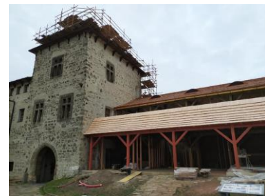
Kunětická hora – v procesu obnovy podle původní podoby Dušana Jurkoviče