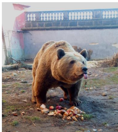
Zákupský medvěd Medoušek